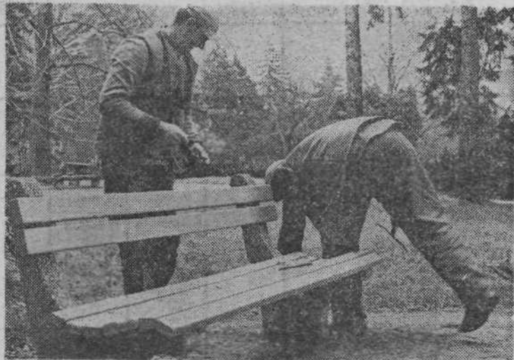
JESENSKA OPRAVILA — Pred začetkom zime so delavci komunalnega podjetja Rast pohiteli z zadnjimi jesenskimi opravili. Tik pred snegom so v Trvoliju pospravili klopi, tako da se bodo utrujeni sprehajalci odpočili le še doma ob topli peči.