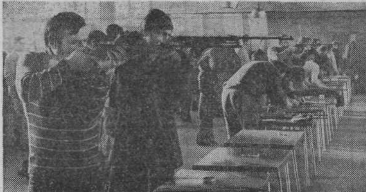
Na letošnjem strelskem tekmovalcu v počastitev dneva JLA bo sodelovalo več moštev kot na podobnem tekmovalcu v lanskem letu. Posnetek je z lanskega tekmovalca, ki ga je odlično izvedla strelska družina Olimpija. Mimi Vončina