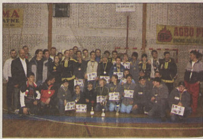
Člani DBV Katana Globoko