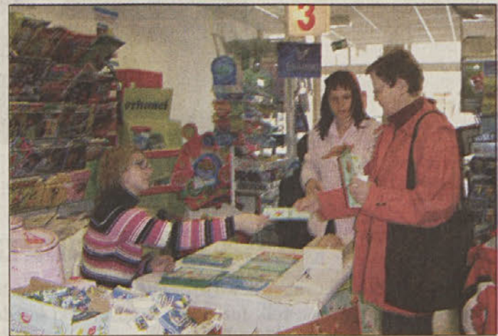
Stojnica, na kateri so medicinske sestre ZD Sevnica ponujale informativno gradivo o raku.

Umrlijivost za rakom lahko torej zmanjšamo le z zgodnjim odkrivanjem bolezni. To pa