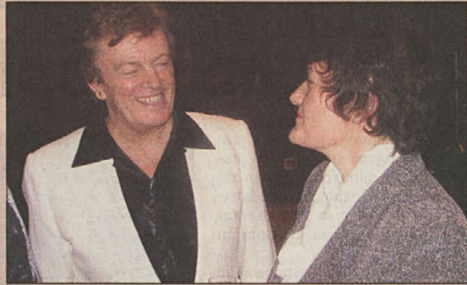
Mirt in Preskarjeva

Upravljanje s Posavjem in posavsko poenotenje pa zna biti kmalu na veliki preizkušnji. Posebej, ker si Brežice lahko pridobijo središnji regionalni položaj. Že sedaj