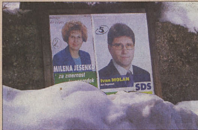
Kdo bo "zmrznil"?