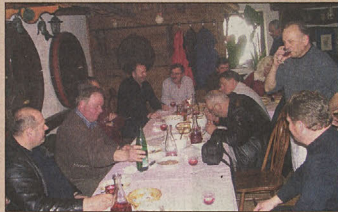
Mučeniki pri Herakoviču

Ob takšni, ta čas najaktualnejši posavski zgodbi, seveda zbledijo problemi delavcev Jutrjanke,