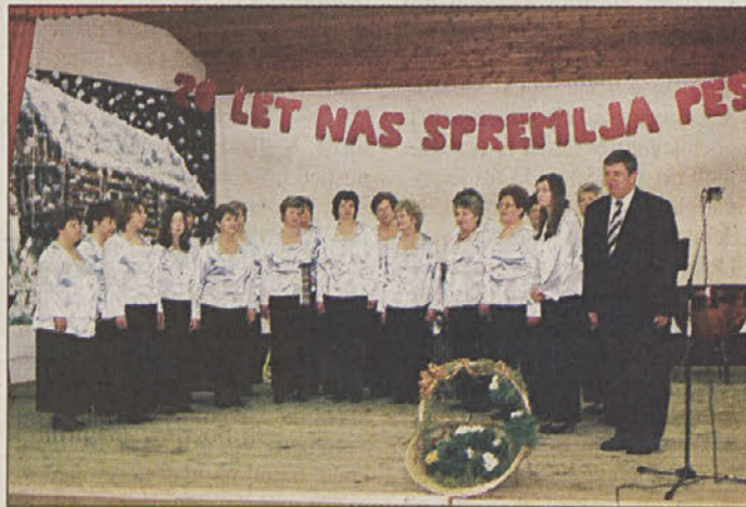
Ženski pevski zbor Kulturnega društva Orlica iz Pišec