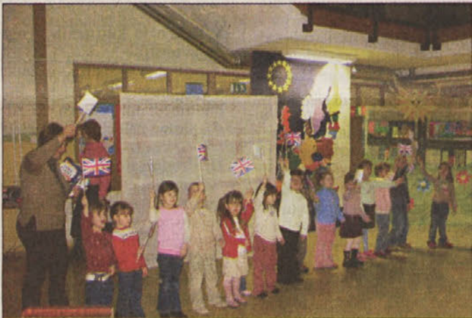
Otroci iz vrtca so s pesmijo predstavili Veliko Britanijo.