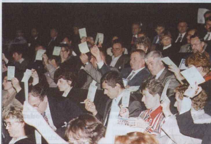
Delegati so glasovali s kartoni, več kot rdečih so uporabili zelenih.