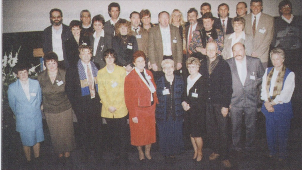
Člani novega republiškega odbora so pred konstitutivno sejo takole pozirali.