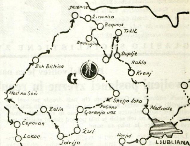
Kurirkova pošta 1967