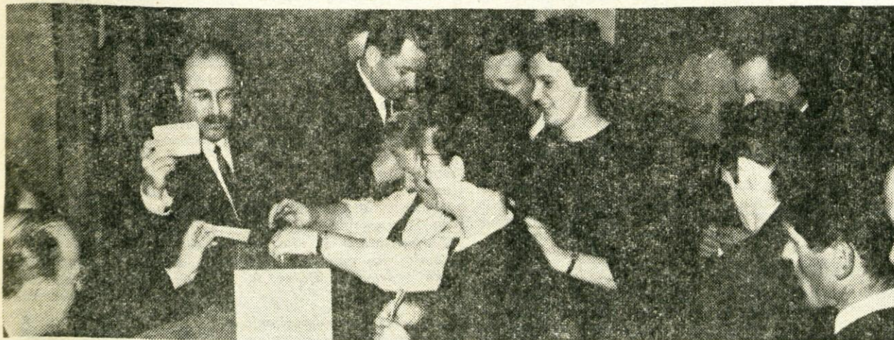
Odborniki kranjske občinske skupščine volijo zvezne in republiške poslance

V petek bo podpredsednik skupščine SRS dr. Breclj obiskal Kranj.