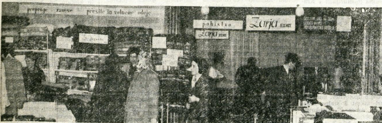
SPOMLADANSKI SEJEM V KRANJU — V soboto, 8. aprila, so v domu Franca Vodopivca v Kranju odprli spomladanski sejem blaga široke potrošnje. Na sejmu sodeluje 13 podjetij in 23 zasebnih razstavljalcev. Na sejmu je razstavljenih največ tekstilnih izdelkov, precej pa je tudi pohištvene opreme, tehničnih predmetov itd. Novost na sejmu je, da Ljubljanske opekarne razstavljajo in prodajajo opeko. V prvih treh dneh si je sejem ogledalo okrog 15 tisoč obiskovalcev, podjetja in zasebni razstavljalci pa so prodali za okrog 50 milijonov starih dinarjev različnega blaga. Sejem bo odprt do 17. aprila.

RTG aparat (z zaščitno steno), zobarska stola, žensko in moško kolo, žimnice, zložljivo železno posteljo, delovni pult s predali, razne karnise, lesene klopi, razne oblike miz in stolov, ležalnike, obešalnike, razne omare in omarice, peči za kurjenje, boiler 8 in 50-litrski, namizne svetilke, zaboj za premo, stenska svetilka (reflektor), pljuvalniki, preobvezovalne mizice, omare za kartoteko, omarice in omare za instrumentarij, stenske zobne vrtalke, sesalec za prah, delovni pult in drugi drobni inventar. Interesenti za nakup, si lahko vsak dan od 8.—12. ure do 15. aprila 1967 ta sredstva ogledajo v zavodu. Do tega roka imajo prednost interesenti družbenega sektorja, po tem roku pa tudi civilne pravne osebe.