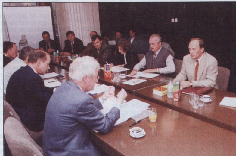
Člani aktiva ZSSS so se zanimali zlasti za možnosti prebroditve razlike med zahtevano in dejansko upokojitveno starostjo

Od tega imajo koristi tudi delodajalci, saj so zaradi dodatka na delovno dobo mlajši delavci cenejši od starejših.