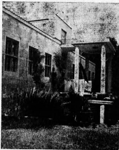
Moderna Galerija v Ljubljani

Strokovnjaki upajo, da bo že 1. 1960 tekla železnica naravnost iz Pariza v Peking. Peljala bo skozi Berlin, Varšavo, Magnitogorsk in Lančou.