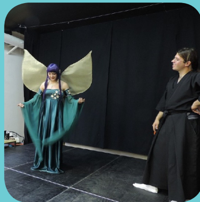
zmagovalka v tekmovanju cosplayerjev