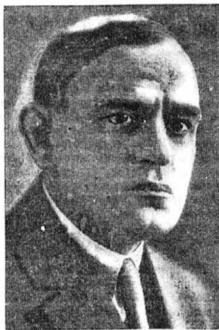
Svetozar Pribičević, ki ga pokopljejo danes v Pragi