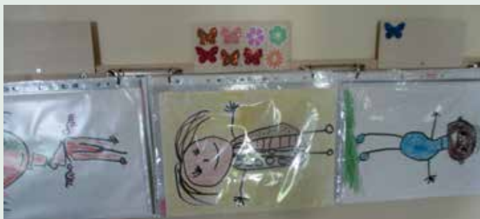
Slika 17: Portfolio na dosegu otrokom.

Dokumentiranje je »vidno« vsem in predstavlja spodbudo za ustvarjanje, bogatenje dokazov o učenju in napredku otroka ter spodbuja medvrstniško vrednotenje in samovrednotenje.