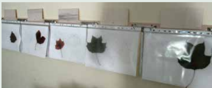
Slika 18: Portfolio na dosegu otrokom.

Dokumentiranje je »vidno« vsem in predstavlja spodbudo za ustvarjanje, bogatenje dokazov o učenju in napredku otroka ter spodbuja medvrstniško vrednotenje in samovrednotenje.