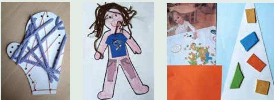
Slike 9, 10 in 11: Dokumentirani dosežki likovnega ustvarjanja 4-letne deklice.

Sliki 7 in 8 prikazujeta napredek v upodobitvi sebe v razdobju treh mesecev. Slika levo prikazuje izdelek iz meseca marca, slika desno pa likovni izdelek iz meseca junija.