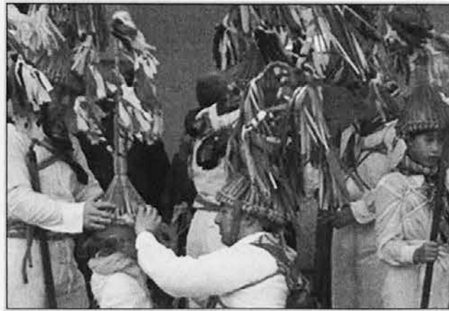
Beneški blumarji, tradicionalna maska iz Črnega vrha

Dan kasneje, t.j. v soboto, so v Beneški galeriji, za katero skrbi Društvo beneških umet-