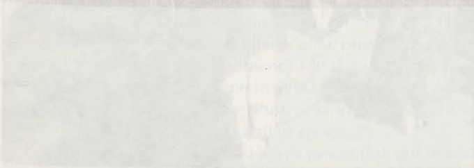
Figure 1: A group of people, likely students and mentors, gathered around a table or display, engaged in an activity related to the ethnological workshop.

The main theme of this year's workshop Škocjan 96 organised by the Youth Friends' Association Ljubljana - Centre, Slovene Educational Association Škocjan and the Department of Ethnology and Cultural Anthropology at the Faculty of Arts in Ljubljana was the life-style and culture of the members of the Škocjan community. Led by their mentors - the students of ethnology, the young from Ljubljana and Škocjan were researching. Our work can hardly be characterised as a serious scientific research, although we gathered the material as "real" ethnologists - through people's narration and professional bibliography. Then we presented it in an essay in the bulletin of the Slovene Educational Association Škocjan, put on an exhibition and made a short presentation at the end of the workshop.