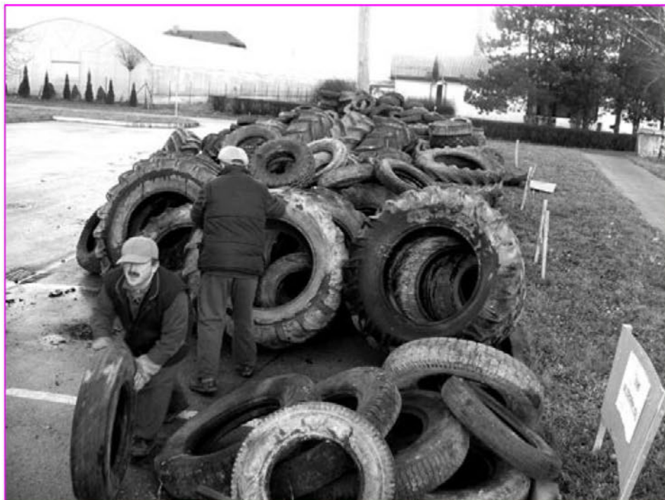
Delavca občinske uprave v delovni akciji