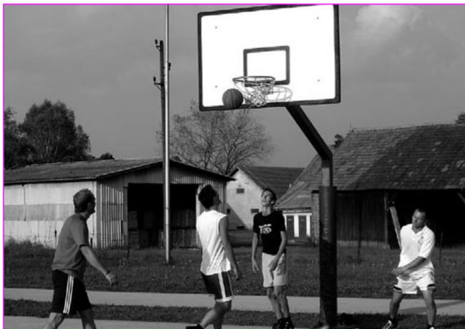
Prijateljska tekma Destrnik – Trnovska vas

Zadnja in letošnja novost med športnimi prireditvami v mesecu oktobru je bila prijateljska tekma v košarki med ekipo iz Destrnika in domačo ekipo iz Trnovske vasi, ki je morala priznati premoč nasprotnikov. Tekma je potekala v petek, 20. oktobra 2006 v šolski telovadnici. Gostje so ob koncu dejali, da so bili veseli pova-