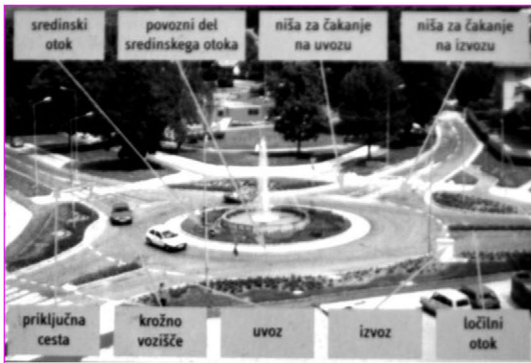
Osnovni elementi krožnega križišča

pred vozili na uvozihi v krožišče; vozila na uvozu na krožišče se v primeru prostega krožnega vozišča ne ustavljajo, temveč z zmanjšano hitrostjo uvozi v krožni tok;