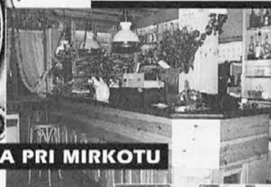
GOSTILNA PRI MIRKOTU

Steverjan, Dvor 5 Zaprto ob četrtkih Tel. (0481) 884035