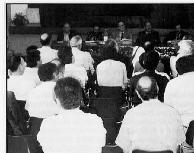
Okrogli mizi je z zanimanjem sledilo lepo število udeležencev

Govorniki so podali pregled najrazličnejših vidikov te problematike, od zunanje trgovine do drobnega gospodarstva in bančnih zavodov, nakar se je razvila živahna in mestoma tudi polemična razprava. V njej so udeleženci priznali, da ima v tem kontekstu politika prvenstveno vlogo, saj mora določiti smernice razvoja v novi situaciji. Odobravanje je žel tudi predlog o obliko-