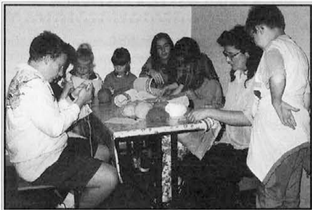
Odrasli in otroci "na delu"

Otroci vsako leto tako nestrpnost čakajo konec pouka, ko pa se jim vroča želja vendarle uresniči, se zavedajo, da je s tem konec tudi zabavne družbe sošolcev. Zato so te poletne pobude zelo dobrodošle. Nad dvajset otrok je prihajalo v zavod, da