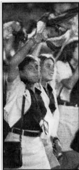
Arianna v paradi na otvoritvi O.I.

V tem socialnem okviru se dogajajo zadnje igre te-