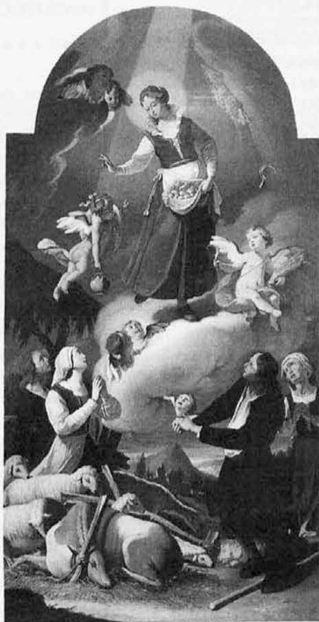
Sv. Notburga, Vremski britof, ž.c. Marijinega vnebovzetja