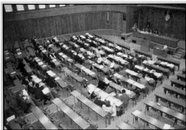
LJUBLJANA: zasedanje slovenskega državnega zbora

zaradi ravnanja in iger posameznih strank čedalje manj verjetne. Medtem je predsednik države Milan Kučan začel postopek o določitvi dneva volitev. Lahko jih bo razpisal že 10. avgusta ali pa najpozneje 9. oktobra. Predstavniki večine strank se zavzemajo, da bi volitve bile sredi novembra, le Liberalna demokracija Slovenije se zavzema za čimprejšnji možni rok; po mnenju te največje politične stranke (vodi jo Drnovšek) naj bi volitve bile v nedeljo, 27. oktobra.