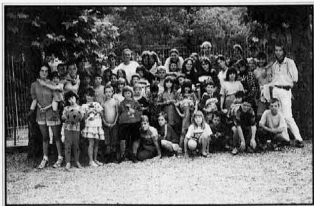
Mali udeleženci kolonije v Comegliansu na dvorišču stavbe, v kateri so prebivali

20. julija smo pričakali avtobus, ki je pripeljal otroke iz gorske kolonije v Comegliansu. Kolonijo je organizirala Slovenska Vincencijeva konferenca.