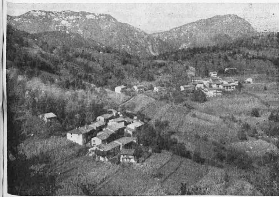
Pogled na hribovsko vas Kau pri Podbonescu