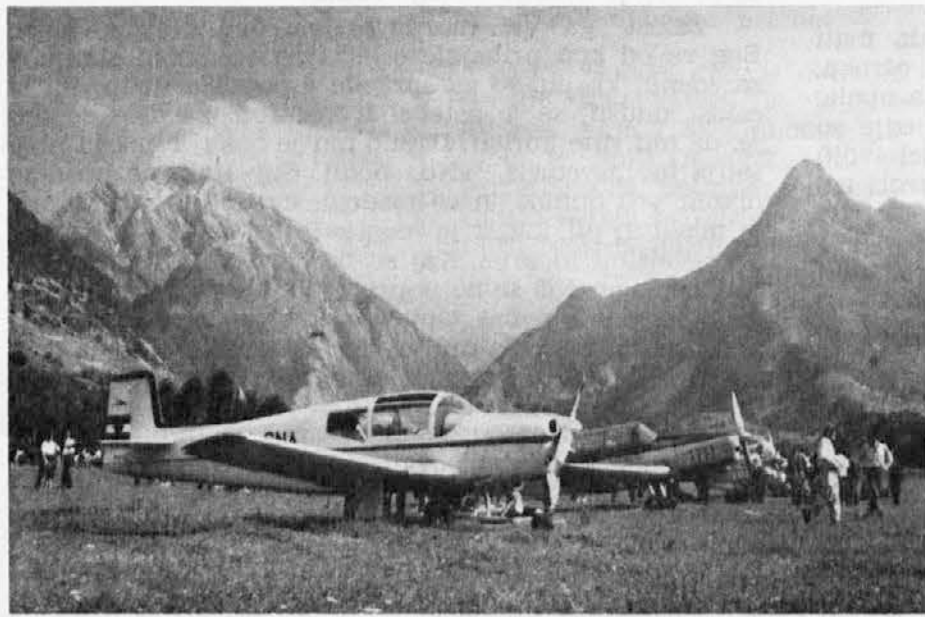
Veduta dell'aeroporto alpino di Bovec (Plezzo)

Pittoreschi e deliziosi sono i dintorni di Trenta ove nasce l'Isonzo. A proposito di Trenta vive la leggenda dello « Zlatorog » (camoscio dalle corna d'oro). Qui c'è posto per tutti, specie per i cacciatori di camosci; e le guide alpine non mancano e sono brave e famose. Sua caratteristica invidiata, però, è un piccolo museo alpino che tutti vogliono visitare. Fuori Trenta, su un'altura, ci si emoziona di fronte al monumento di Julius Kugy, poeta della montagna e figura di grande fama, mentre vi incanterano l'aspetto stupendamente selvaggio della gola della Mlinarica e la flora dell'« Orto Alpino Juliana » unico nel suo genere.