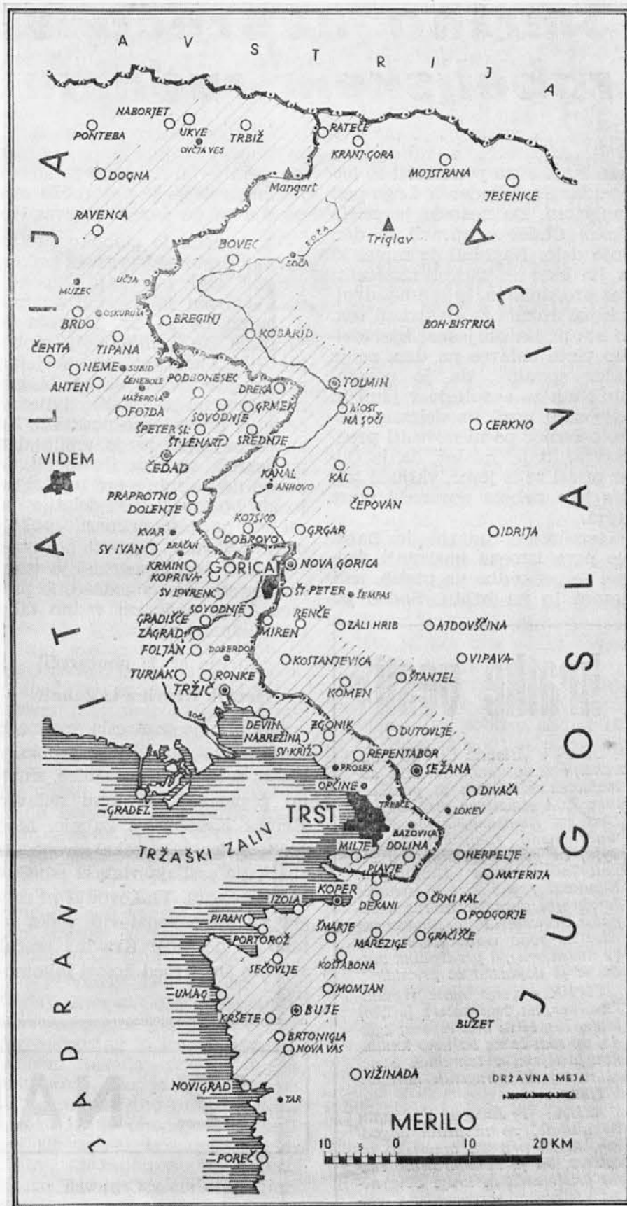
Desetkilometerski pas, kjer se izvaja mali obmejni promet med Italijo in Jugoslavijo

Država in dežela morata izdati take zakone, ki bodo upoštevali tudi socialni moment naših krajev, da se bodo mogli industrializirati in si tako zagotoviti nadaljni življenjski obstoj.