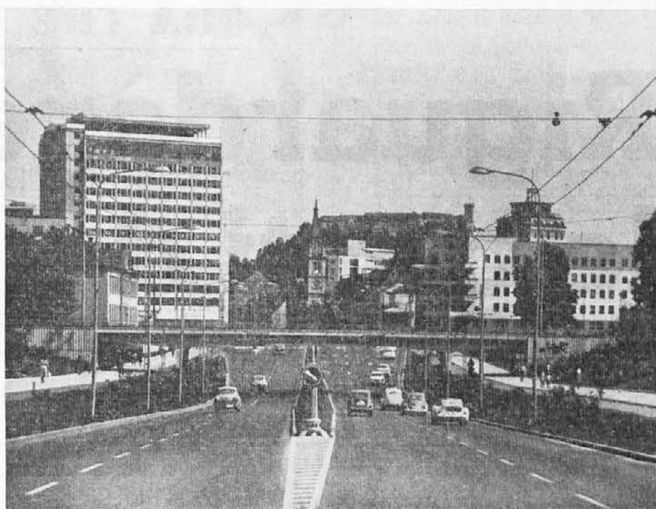
Ob vhodu v Ljubljano, prestolico Slovenije, vidimo novozgrajeni hotel Lev - V ozadju znameniti grad

V tem času je oče pri vojakih obupaval in si ni znal pomagati. Silno rad bi bil prihranil kaj za pomoček domačim. Toda kaj in kako? Kar je dobival, je bilo nezadostno, vendar je slednje stotinko hranil in zbiral in