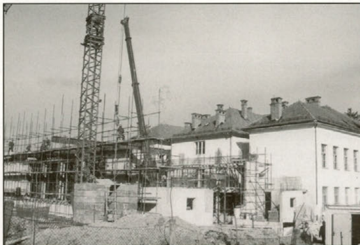
Dokončanje prizidka k osnovni šoli in telavnice je v Leskovcu v planu do konca leta