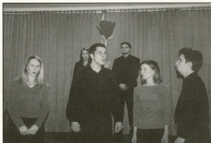
Utrinek iz bogatega kulturnega programa