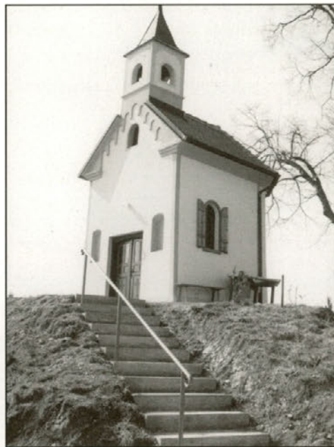
Do kapele v Skorišnjaku po stopnicah