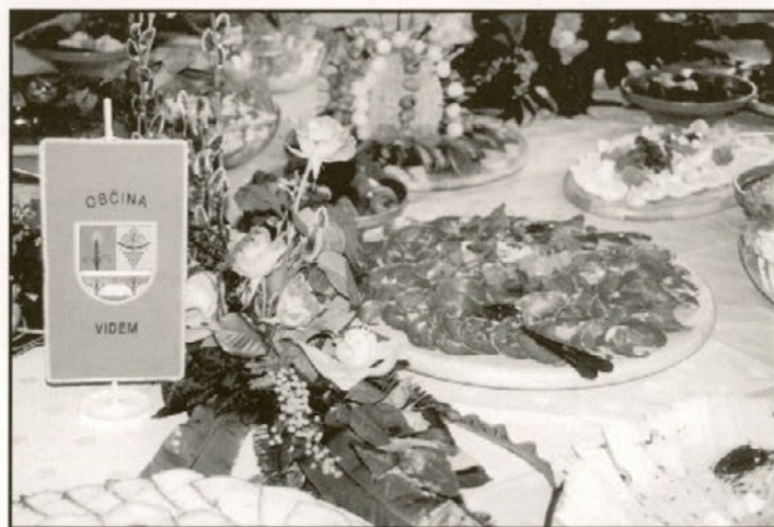
Pogled na bogato obloženo mizo dobrot, ki so jih pripravili v Rekreativskem centru Dravinja

Videmski župan je ob predstavitvi zloženke izrazil zadovoljstvo, da je le-ta izšla, kot so načrtovali, za občino pa pomeni povod k bogatenju nadaljnje turistične ponudbe. Z zloženko bo zdaj videmska občina skrbela za še boljšo promocijo, da pa bo na področju turizma več uspehov, bo po besedah župana potrebno trdo delati, kajti samo sprejeta strategija turizma do leta 2004 v občini je premalo, od turizma pa si smejo veliko obetati.