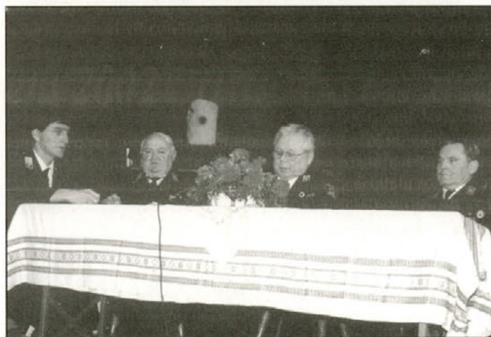
Na občnem zboru PGD Tržec

izobraževanje smo poslali tri naše člane, tečaj za izprašanega gasilca je potekal v Tržcu, dva člana sta opravila tečaj za strojnike in vodjo enot. Vsem so se zahvalili za vložen trud in zaprosili, da nas podprejo tudi ob novih akcijah, saj imamo v programu zamenjavo avtocisterne z novim in sodobnejšim vozilom, ki ga potrebujemo na našem precej razgibanem terenu.