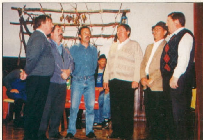
Za dobro vzdušje so poskrbeli s kulturnim programom