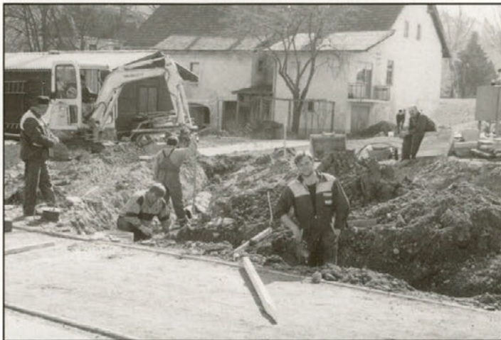
Pri videmski OŠ poteka gradnja priključnega sistema na kanalizacijo Videm

V letošnjem letu imamo v načrtu kar nekaj investicij na območju naše občine. Nekaj od teh vam na kratko predstavljamo skozi fotografije, narejene sredi marca.