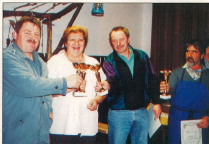
Najboljši kletarji in pridelovalci nagrajenih dobrot