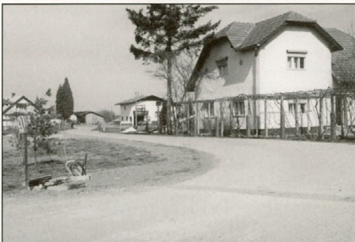
Ureditev javne razsvetljave v naselju Pobrežje - Boršt še letos