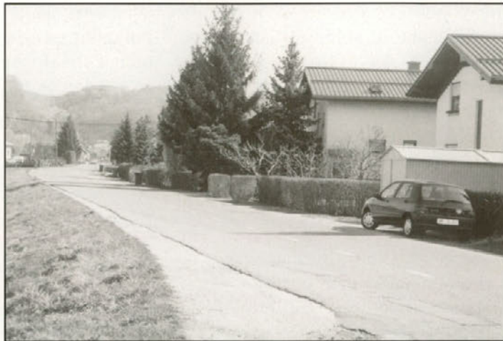
Izgradnja pločnika in javne razsvetljave na odseku od pokopališča do kapele Boško - le ena od letošnjih naložb