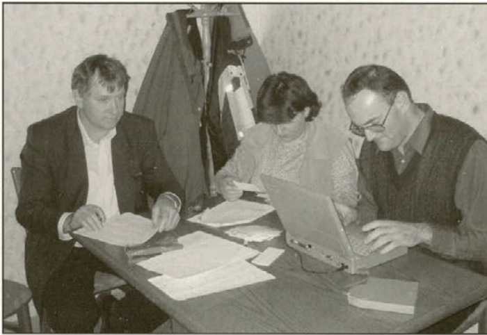
Tako je potekalo ocenjevanje ...