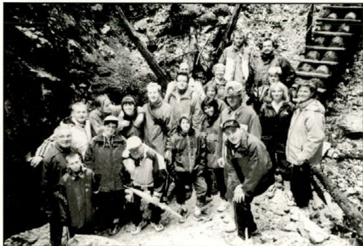
Gledališčniki na izletu po lanski uspešni sezoni