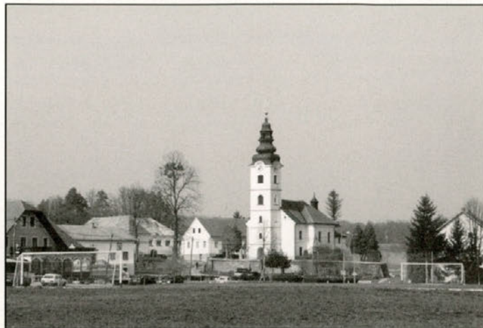
Leskovec - nova občina?

Ljudje pa si postavljajo tudi vprašanje, kaj če v teh prizadevanjih za novo občino ne boste uspeli?