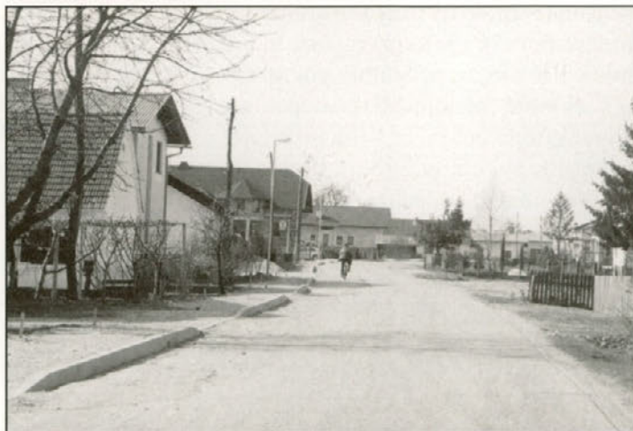
Dokončanje pločnika ter javne razsvetljave skozi naselje Lancova vas (z deli pričeli že lani)