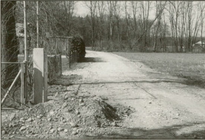
Predvidena ureditev vodovoda in ceste v smeri Sela - lovski dom