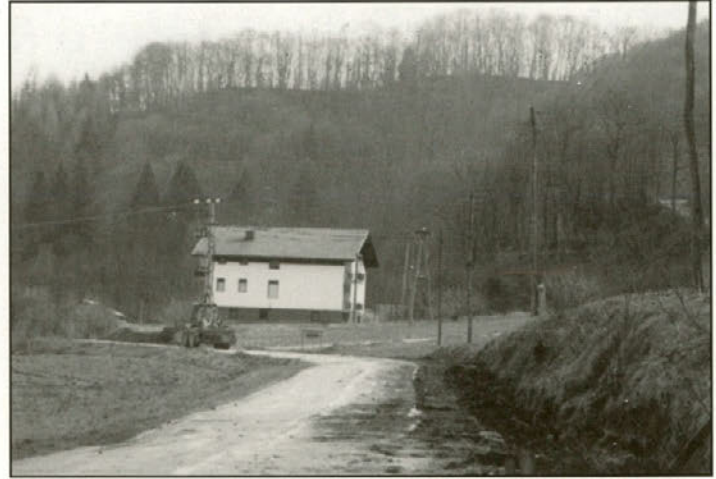
Nadaljevanje gradnje vodovodnega omrežja v Doleni

Pripravila: Aleš Gregorec, Tatjana Mohorko