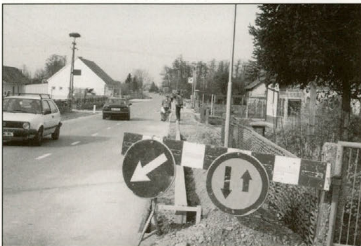
Preplastitev ceste, izgradnja pločnika in javne razsvetljave skozi naselje Tržec; dela so v teku