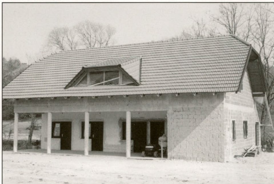
Novi športni prostori ŠD Leskovec

poleg tega sta ekipi igrali na številnih turnirjih v velikem in malem nogometu, organizirali smo velik nogometni turnir za Haloški pokal v Leskovcu (v mesecu juniju 2001), mali nogometni vaški turnir (v mesecu avgustu 2001), ekipi sta sodelovali in nastopali v dvoranski ligi občine Videm, ekipa veteranov NK Leskovec se je udeležila nekaj nogometnih turnirjev, organizirali smo medobčinski šahovski turnir posameznikov (v mesecu februarju 2001) in še bi lahko naštevali. Poleg vseh teh aktivnosti, smo člani ŠD aktivno sodelovali tudi v nekaterih projektih drugih društev in organizacij v kraju.