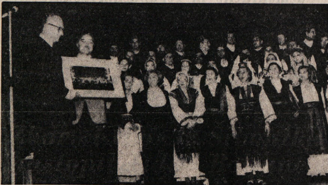
Mešani pevski zbor «Kolo» iz Šibenika, ki je v soboto zvečer nastopil v tržaškem Kulturnem domu...