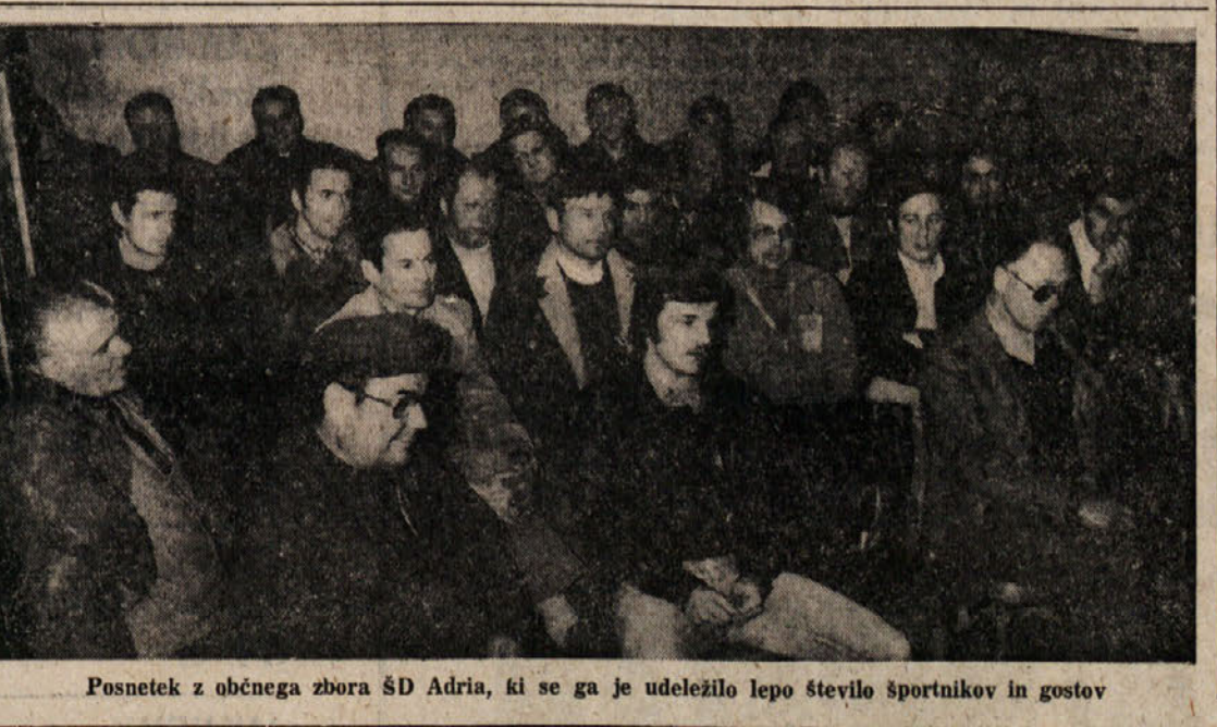
Posnetek z občnega zbora ŠD Adria, ki se ga je udeležilo lepo število športnikov in gostov

Včerašnjo šahovsko partijo v Beogradu med Spasskim in Korčnejem sta tekmovalca prekinila v 42. potezi. Ob končnici je bil Korčnoj v boljšem položaju.