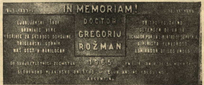
Ljubljanski škof — branilec vere — borilec za svobodo domovine — triglavske gornik — naš gost v Bariločah. (Slovensko besedilo na bronasti plošči)

Zato si je v preroškem navdihu odkazal svoje škofovsko geslo: „Križa teža — in plačilo!“ Geslo, ki je v vsej svoji silovitosti pronicalo v njegovo uso-