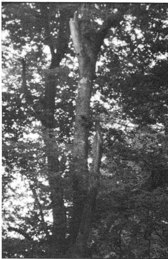
Slika 1: Gnezdišče balkanskega detla Dendrocopos lilfordi z duplom, pragozd Pečke 1990

Balkanski detel se zadržuje v starih bukovih, bukovo-gabrovih in v reliktnih gozdovih oreha in leske ter tise in jelke; zelo redko zaide v mešane gozdove bukve-jelke-smreke in v gozdove grške jelke ( Abies cephalonica ). Ni ga v čistih smrekovih, smrekovo-jelovih in v čistih gozdovih jelke ter tudi v vseh tipih borovih gozdov. V podgorskih hrastovih gozdovih se pojavlja le pozimi. Geograf- sko je omejen na Balkan, kjer živi na planinskih masivih, na zahodu vzdolž severnega dela Dinarskega gorstva do Gorskega Kotarja, na severu do Slavoni- je, na jugu do Parnasa in Peleponeza v Grčiji (Matvejev, 1976).