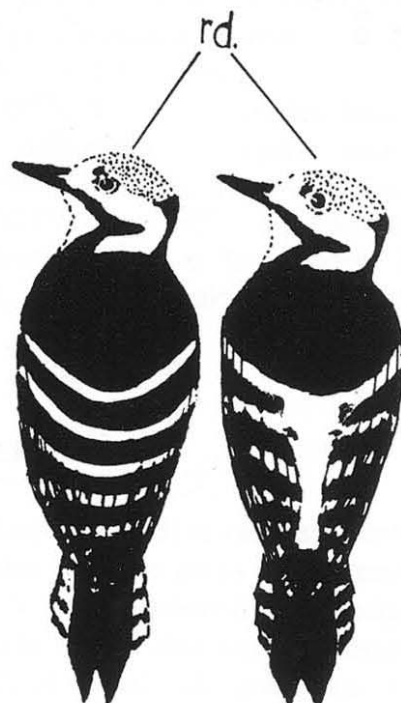
Slika 2: Risba hrbta pri balkanskem (levo) in belohrbtem detlu (desno)

3. V. 1934, Plitvička jezera, Muzej v Zagrebu