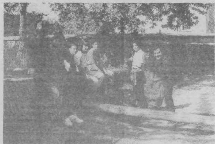
Najboljša je bila letos ekipa krajevnega organizacije ZRVS Kodeljevo. Člani ekipe čakajo na razglasitev rezultatov

25. maja 1989 sem bila prijetno presenečena nad dogajanjem na igrišču te enote v popoldanskem času. Že prejšnji dan smo bili vsi starši vabljani, naj naslednji dan ne hitimo z otrokom domov k vsakdanjnim opravilom, marveč naj se skupaj z njim zaigramo na igrišču. In kaj vse so tovarišice in ostali delavci za nas in naše malčke pripravili: