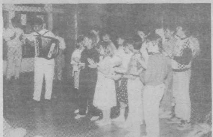
Prejšnji mesec so nas za nekaj dni obiskali otroci naših zdomcev, ki so vključeni v KSD Planinka v Ravensburgu, s katero že dolgo let sodelujemo. Bili so gostje učencev OŠ Edvarda Kardelja v Polju, kjer je na skupni prireditvi nastal tudi ta posnetek

republik in pokrajin Jugoslavije. Na srečanju, ki je potekalo pod naslovom Bratenje osnovnih šol in je bilo že deseto po vrsti, so privkrali sodelovali tudi iz OŠ Novi Sad, Sarajevo in Priština, čeprav predstavniki iz zadnjega mesta zaradi objektivnih vzrokov niso mogli priti v Ljubljano. V okviru srečanja so pripravili strokovni seminar, njegova glavna tema pa je bila Prenova življenja in dela na osnovni šoli. Zvečer so si gostje v Kulturnem domu Španski borci ogledali igro Srečka Čoza, ki je bil avtor besedila, režiser in scenarist hkrati. O fantu, ki so mu rekli budala smotana, zaigrali pa so jo učenci OŠ II. grupe odredov.