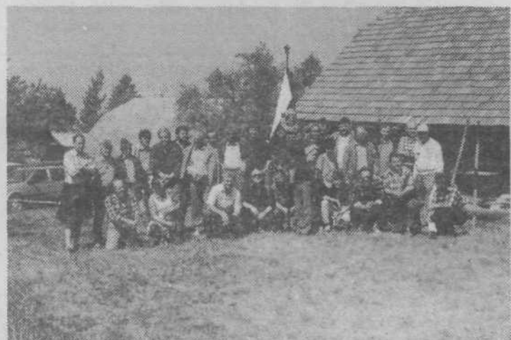
Skupni posnetek nastopajočih ekip RVS na Jančah