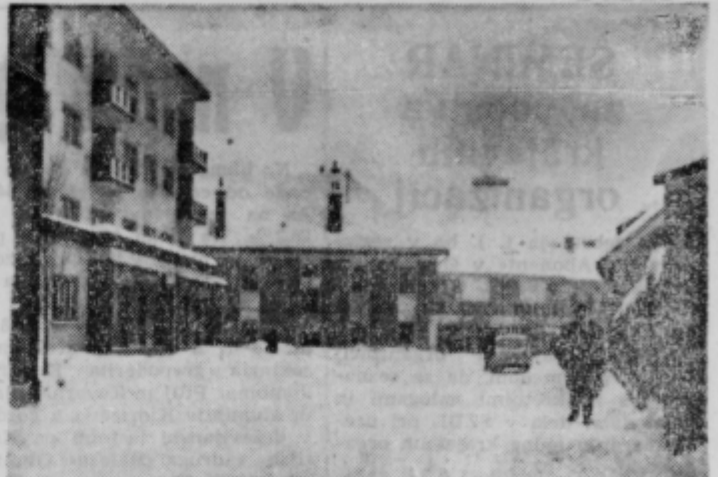
PTUJ: Trstenjakova ulica z lekarno, »Poetovio« in »Opremo«. Obrat kombinata »Slovenske gorice« z desne

*Tednik« izhaja pod tem skrajšanim imenom od 24. nov. 1961 dalje na predlog Občinskih odborov »ZDL Ptuj in Ormož« — Izdaja »Tednik« časopisno podjetje »Ptujski tisk« Ptuj — Odgovorni urednik: Anton Bauman — Uredništvo in uprava Ptuj, Lackova 8 — Telefon 156 čekovni račun pri Narodni banki Ptuj št. 604-19-1-409 — Tiska časopisno podjetje »Matičarski tisk« — Rokopisov ne vračamo — Celoletna naročnina za tuzemstvo 1000 din, za inozemstvo 1500 din.