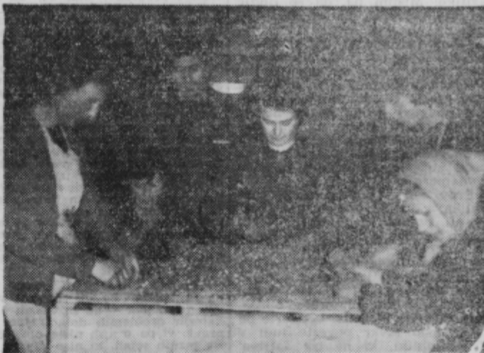
Lučke je treba pred sejanjem prebrati

Vzporedno z migracijo podeželskih prebivalcev v mesta se iz dneva v dan pojavljajo občutnejše potrebe po zelenjavi. Za dostopne cene zelenjave je poleg ostalih kmetijskih pridelkov vsekor odločilna rentabilnost proizvodnje, ki poleg primerne produktivnosti dela zaposlenih vpliva na večjo in kvalitetnejšo izbiro blaga na tržišču.