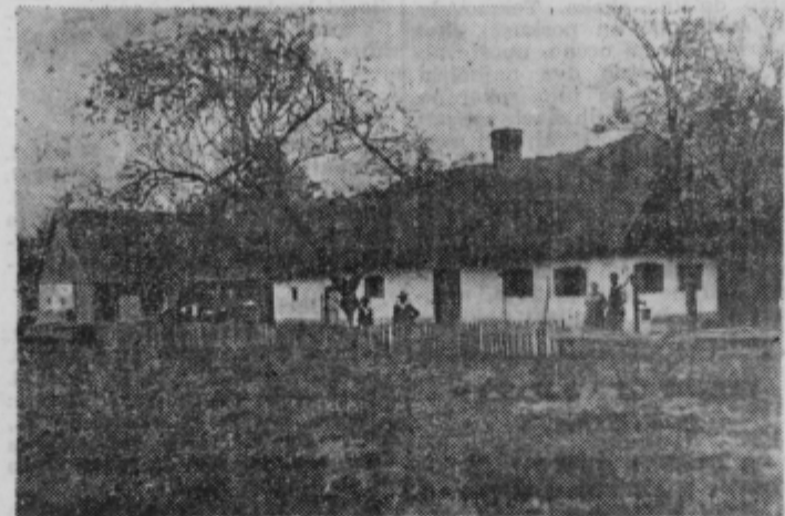
Puhova rojstna hiša

Leta 1857 se je poročil z Nežo Cizerl in premožne gruntarske hiše v Oblačku (urb. številka gospodstva Ptujski grad 351 in že tri leta pozneje kupil od Janeza Cizerla, verjetno ženinega sorodnika, za 300 goldinarjev vinograd na Oblačku s hramom in kletjo. Leta 1864 je žena podedovala po materi vinograd v neposredni sosesčini z onim, kuplje-