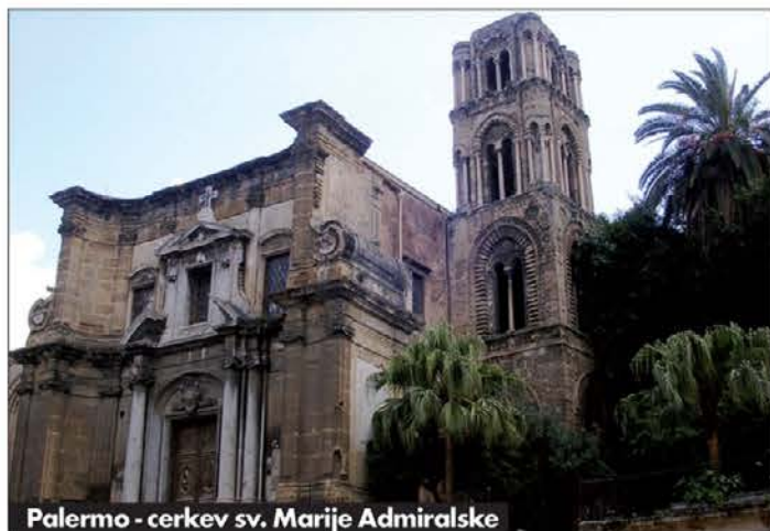
Palermo - cerkev sv. Marije Admiralske

Proti večeru smo se odpravili v glavno sicilsko mesto Palermo. Na avtocesti v Capacijo, ki je oddaljen od Palerma skoraj 25 km, smo se ustavili pred spominskim obeležjem, ki označuje zločinski atentat na Falconeja in Borselina 23. maja 1992. Ime mesta Palermo izvira iz grške besede Panormus, kar pomeni vse-pristanišče. Mesto se razprostira v obliki velike pahljace, nad mestom se razteza gorovje. Tu so se zvrstili številni narodi že od pozne antike vse do današnjih dni. Ogledali smo si le nekatere pomembne znamenitosti, ker za vse bi morali ostati več dni v tem mestu. Stolna cerkev je posvečena zavetnici Palerma sv. Rozaliji. Veličastna stavba z baročnimi značilnostmi stoji na temeljih nekdanje katedrale, ki so jo zgradili Normani. Obiskali smo tudi