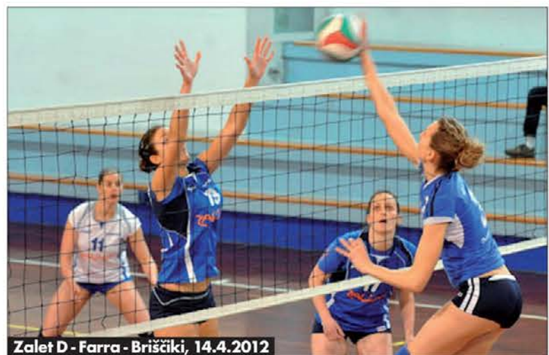
Zalet D - Farra - Briščiki, 14.4.2012

Tokrat bi se zato malce bolj poglobili v zgodbo druge šesterke Zaleta, ki je klavno nazadovala iz deželne D lige v pokrajinsko prvo divizijo. Pred nekaj tedni smo že nakazali problem občutnega osipa tekmovalk v ženski odbojki in roza športu pri nas nasploh. Zakaj so nekoč slovenski sestavi celo z medsebojnimi derbiji za napredovanje krojili vrh C lige, ali tekmovali kar v državni B ligi, danes pa smo ostali z eno samo ekipo na deželni ravni? Kam gredo odbojkarice, ko dopolnijo 18 let? Mar je prihodnost le v nezahtevnem igranju v "udobni" prvi divizion, kjer je dovolj priti dvakrat tedensko v telovadnico in so konci tedna praviloma prosti? Zagotovo to ne more biti vzgib, ki žene naprej naše gibanje.