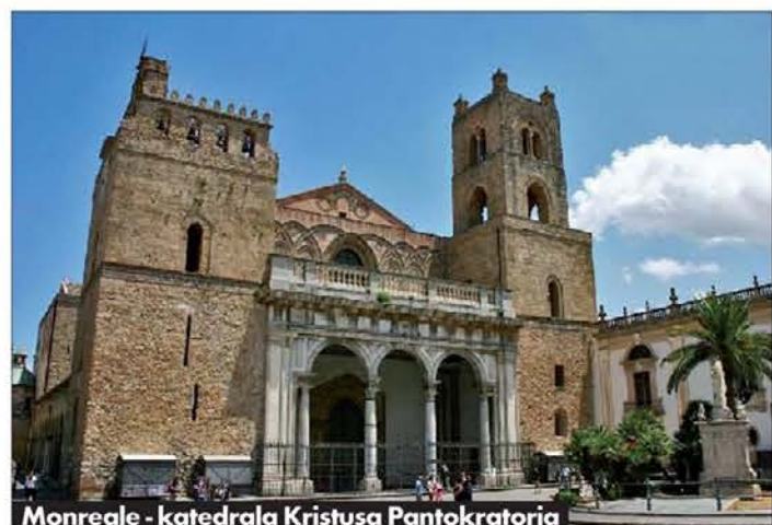
Monreale - katedrala Kristusa Pantokratorja

pokristjanili. Zadnji dan dopoldne smo se odpeljali v slikovito mesto Cefalu'. Tudi tu je stolna cerkev posvečena Kristusu Odršeniku. V cerkev se pride po stopnišču, ki je okrašeno s kipi in kovanim železom. Mogočna fasada z dvema zvonikoma kaže na normansko-romanski slog (13. stoletje). Prezbiterij v notranjosti cerkve kot tudi vse tri ladje so okrašeni z bizantinskimi mozaiki. Prikazujejo prizore iz Stare in Nove zaveze. V kupoli apside kraljuje Kristus Pantokrator, pod njim pa je Devica Marija z apostoli in nadangeli. Sprehodili smo se po glavni ulici in si ogledali nekdanji grad oz. utrdbo normanskega kralja Rogerija II. "Osterio Magno" iz 13. stoletja, nadalje smo videli srednjeveško pralnico, v njeni bližini so bila prva javna kopalnica še v času Rimljanov, kamor naj bi zahajal tudi rimski zgodovinar Cicero. Čakalo nas je tipično sicilsko kosilo. Nato smo se odpravili na letališče. Od tod smo poleteli v Benetke, kjer nas je že čakal udoben avtobus, s katerim smo se odpeljali v Gorico in na Opčine. Udeleženci potovanja so se vsi zdravi in zadovoljni vrnili na svoje