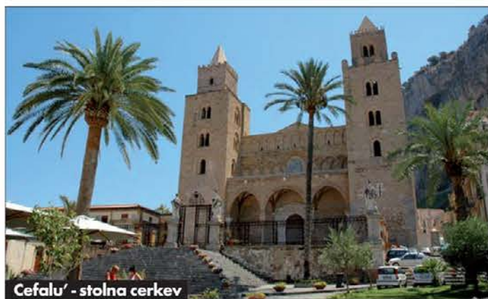
Cefalu' - stolna cerkev

portal Nebeška vrata nas uvede v cerkev, ki je okrašena s številnimi bizantinskimi mozaiki, nad katerimi kraljuje veličastni Kristus Vse-držitelj. Podobno smo naslednje jutro videli tudi v Cefaluju. Ob katedrali je tudi nekdanji benediktinski samostan. Normanski vladarji so sploh podpirali benedik-