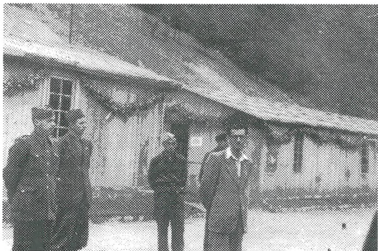
Avtor v civilni obleki na obisku pri slovenskih brigadirjih na delovišču železniške proge Šamac-Sarajevo maja 1947

Mladinske delovne akcije so bile nepogrešljive za hitro izgradnjo pomembnih infrastrukturnih objektov