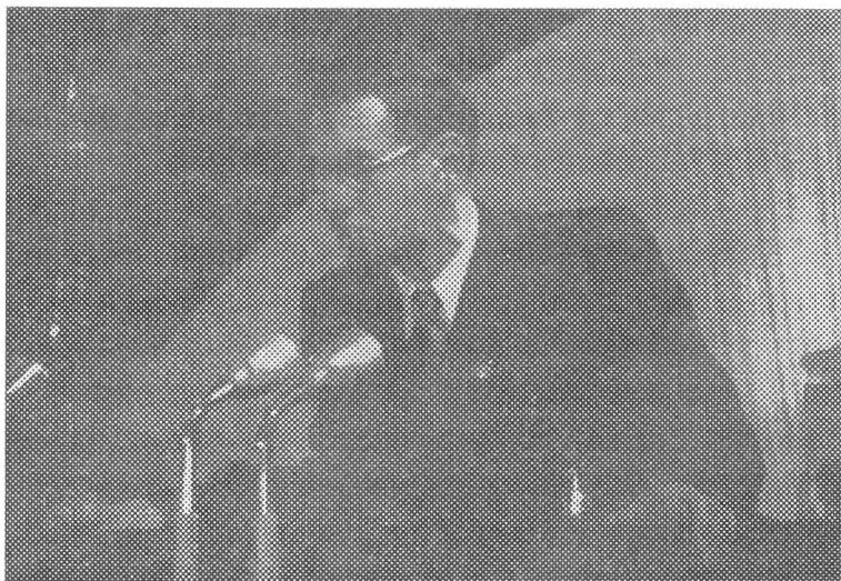
Avtor med govorom delegatom in gostom IV. kongresa LMS