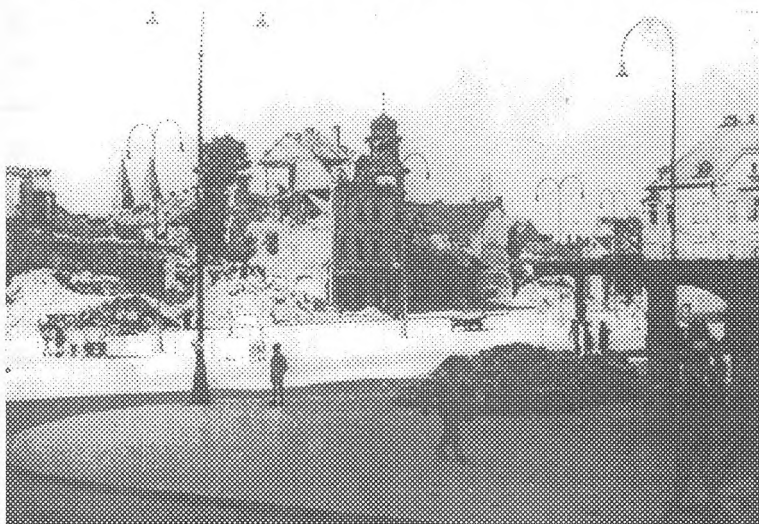
Porušeni Glavni trg v Mariboru leta 1945

Jugoslavija je sodila med najbolj porušene evropske države v drugi svetovni vojni. V Sloveniji je bilo najbolj prizadeto podeželje, kjer je okupator uničil zelo veliko vasi (Notranjska, Kočevska, Primorska, Dražgoše na Gorenjskem in drugje po Sloveniji). Poškodovane so bile tudi ceste in železnice, zlasti večji mostovi in viadukti. Zavezniško letalstvo je bombardiralo tudi več mest, posebno tista, v katerih je bilo veliko okupatorske