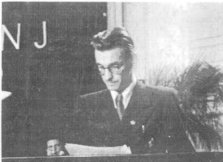
Avtor med govorom na III. kongresu Ljudske mladine Slovenije junija 1947 v Ljubljani

na področja, analiz dejanskega stanja med mladino, njenega razpoloženja in eksistenčnih potreb pa je bilo premalo. Ob navdušenju mladih za novo državo, za nastajajoči sistem socialne pravičnosti in za prostovoljne delovne akcije „visoka“ strokovna statistika sploh ni bila utemeljena. Zato sem menil, da je treba sprotne in dolgoročne naloge opredeljevati in uresničevati na temelju ocenjevanja dejanskega gmotnega, izobraževalnega, političnega in drugega stanja med mladino in to povezovati s celotnim dogajanjem v družbi, „statistiko“ pa omejiti na najnujnejšo raven.