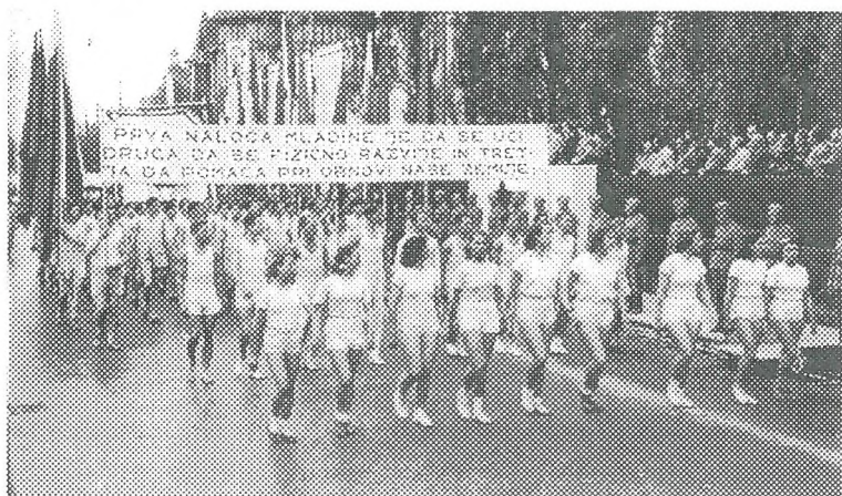
Mladinke in mladinci na prvomajski paradi leta 1948 v Ljubljani

športna društva in mnogi med njimi so tudi dosegali vrhunske športne uspehe. Zagovorniki takega gledanja so še menili, da zlasti vrhunski šport deli ljudi na ozek