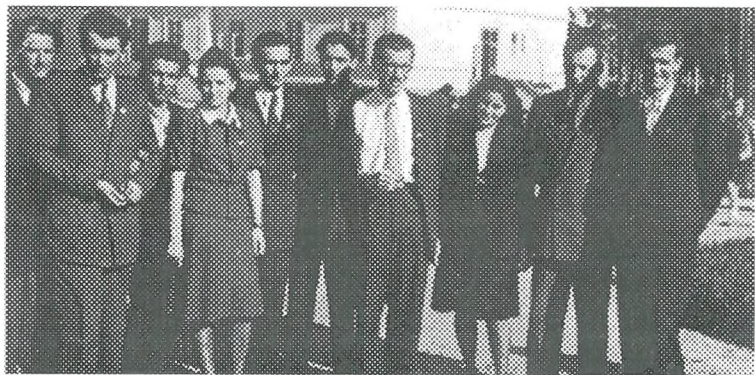
Avtor (v sredini) z vodstvom mladinske organizacije Bosne in Hercegovine na Ilidži pri Sarajevu maja 1949