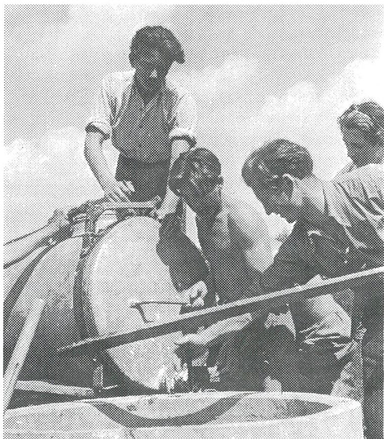
Na gradbišču združnega doma v Kapeli (iz gradiva Muzeja novejšje zgodovine v Ljubljani)

jev in brigadir. Samo v coni B slovenskega Primorja, oziroma v vzhodnoprimorskem okrožju, se je leta 1947 na delovne akcije prijavilo 1466 mladincev in mladink. Seveda so vse to spremljale tudi različne organizacijske težave in posamezne napake, ki se vedno pojavljajo ob človeškem delu, pa naj bo še tako ustvarjalno. Odgovorni so namreč ljudje z vsemi dobrimi in včasih