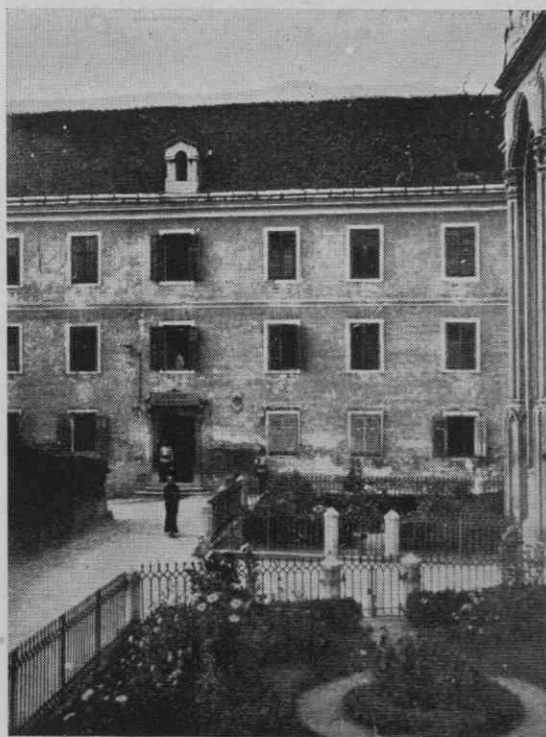
Poslopje stare novomeške gimnazije