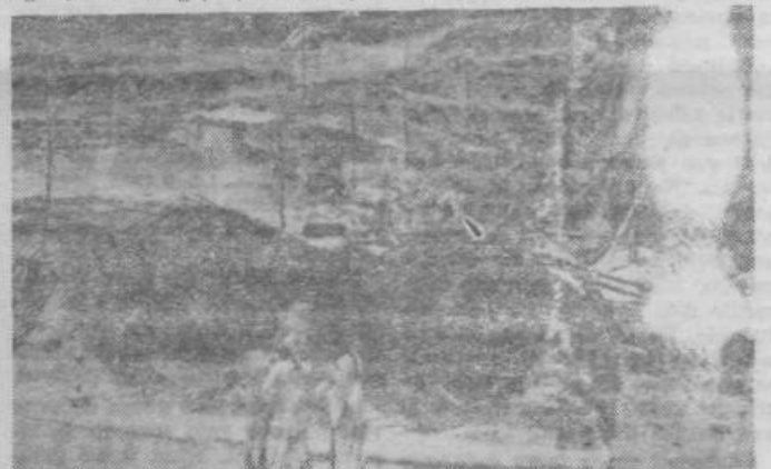
Namakalni sistem predstavlja v Indiji v posameznih pokrajinah pogoj za obdelavo zemlje. Zato se indijska vlada zelo trudi, da bi zagotovila sistem namakanja in da bi z razširitvijo mreže prekopov povečala obdelovalne površine. — Na sliki: Polaganje tevi, ki bodo dovedle vodo na oddaljena zemljišča.

jetjem ugodne kredite. Po drugi strani pa je bil uveden cel niz omejitev, ki so usmerjene k podrejanju zasebnega kapitala ekonomski politiki vlade. Po doseženih tečajih je mogoče šteti, da bodo te omejitve čedalje bolj