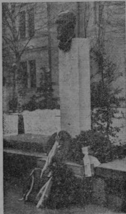
Slovitemu skladatelju Antonu Foersterju je postavila Glasbena Matica v Ljubljani ob stoletnici njegovega rojstva spomenik.