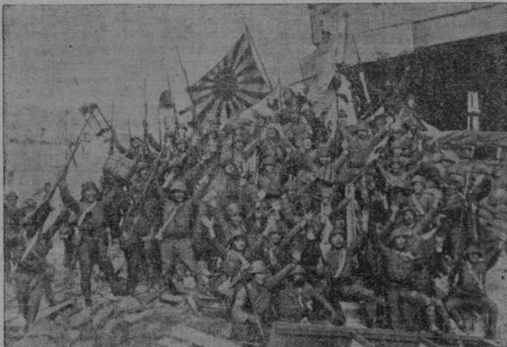
Veselje japonskega vojaštva radi zasedbe kolodvora v Sangaju.