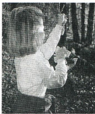
Iskanje povitičk od ptičje gostije.

Lansko leto so otroci prvič spoznali običaj gregorjevanja; izdelali so plavajoče hišice, ladjice ter se naučili splet otroških iger, izštevanek, plesov in pesni. Tako so številnemu občinstvu staršev, dedkov, babic in ostalih obiskovalcev pokazali igrice Ptički v gnezdu, zaplesali in zapeli po belokranjsko in pod grmovjem iskali. Če so ptički slučajno kaj pustili od ptičje ohceti. In res je bilo!