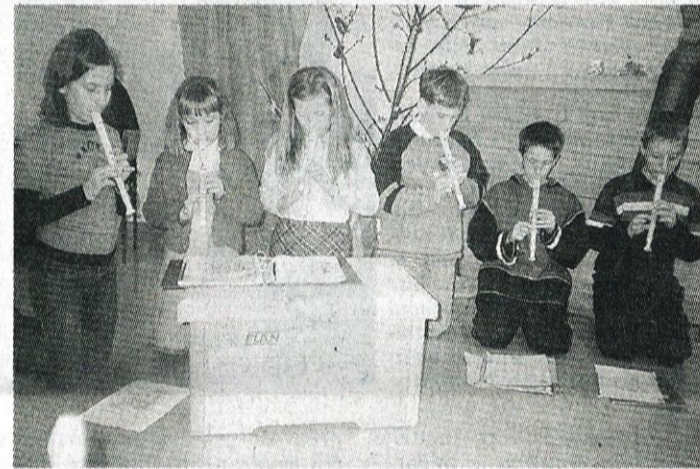
Skupina flavtistov je zaigrala šopek pomladnih pesmi.