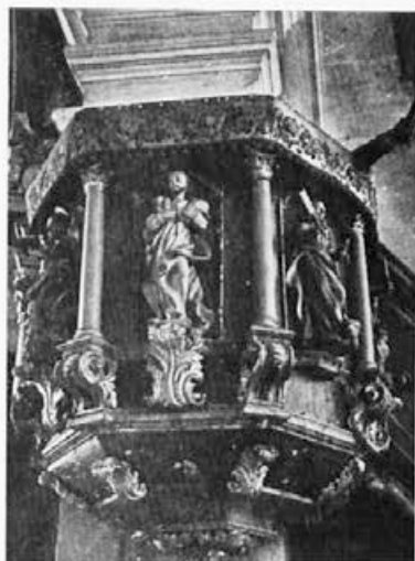
6 Brestanica, začetek 18. stoletja