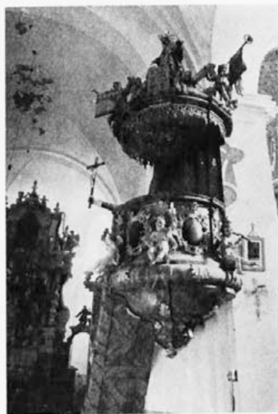
17 Sentjanž nad Radljami ob Dravi , druga tretjina 18. stoletja