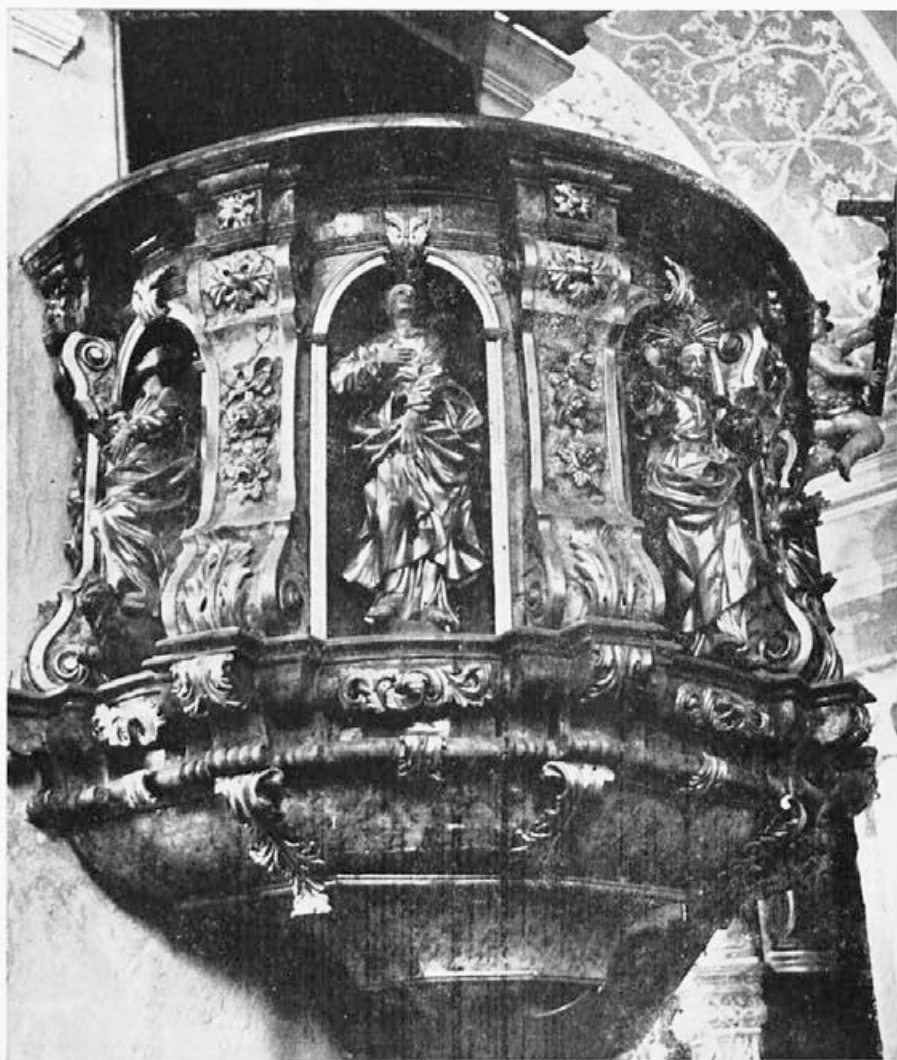
5 Mihael Pogačnik: Ruše, 1724—1735