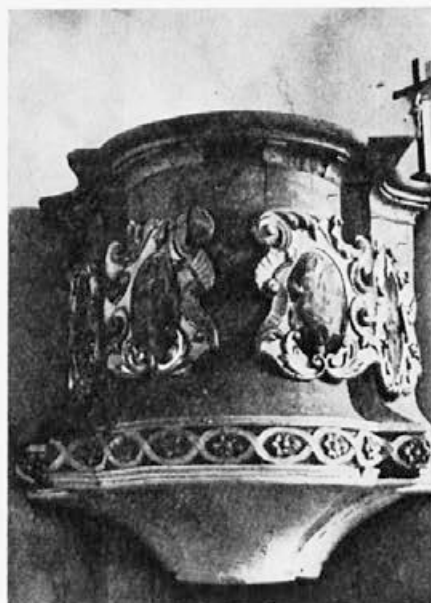
12 Sentjanž pri Stefanu pri Žu-smu, prva polovica 18. stoletja