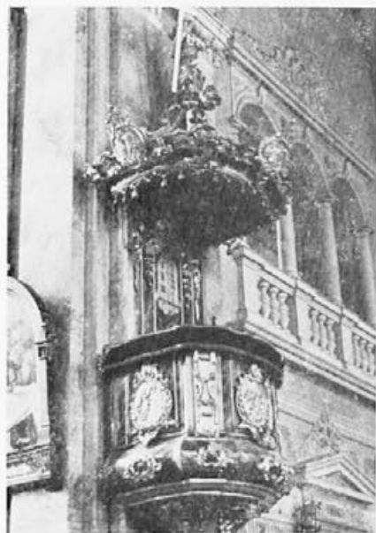
20 Vid Köninger : Zalec, 60. leta 18. stoletja