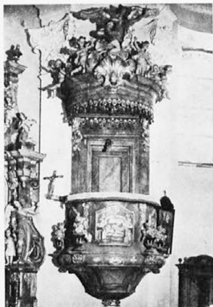
15 Jožef Straub : Rogatec, 50. leta 18. stoletja