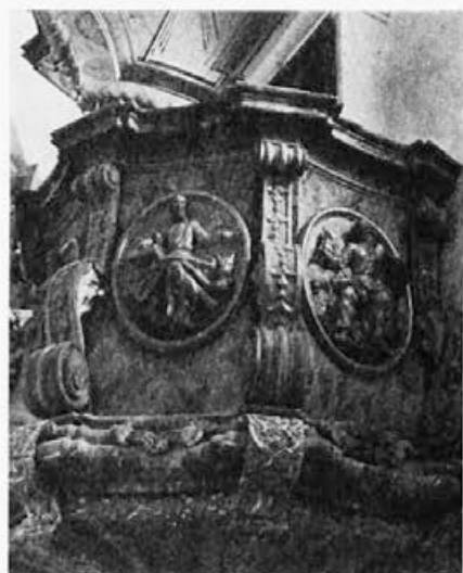
10 Jeruzalem v Slovenskih goricah, druga četrtina 18. stoletja