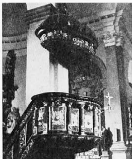
2 Pušcava na Pohorju, druga polovica 17. stoletja