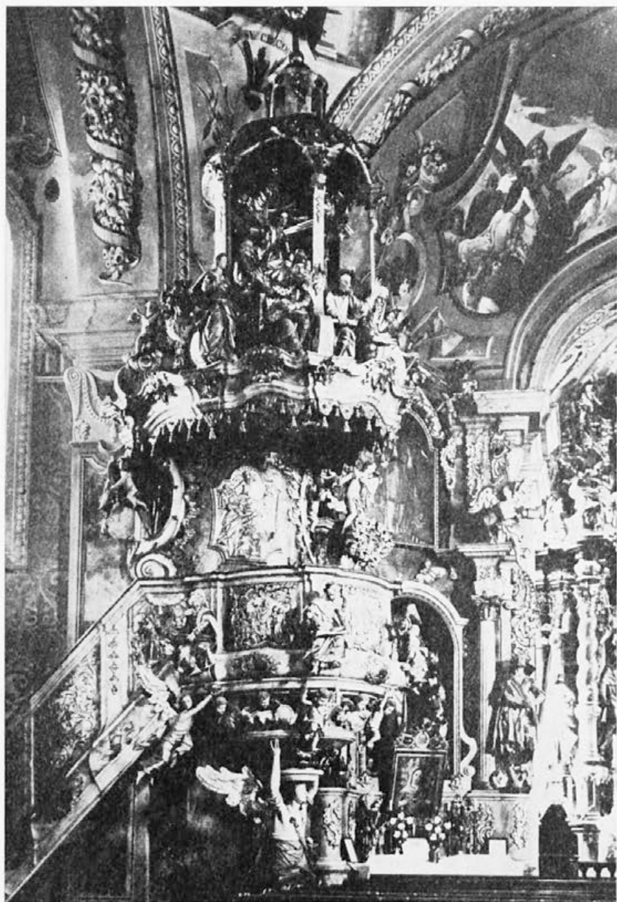
22 Janez Jurij Mersi: Ponikva, 1771