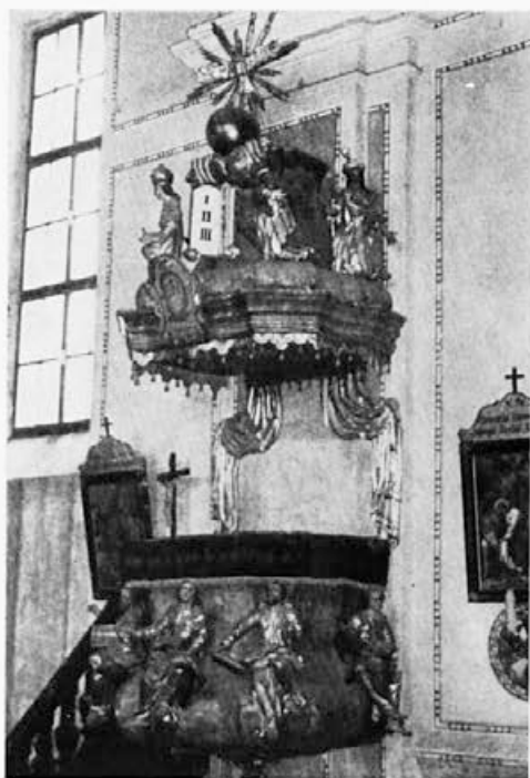
8 Duh na Ostrem vrhu, prva polovica 18. stoletja