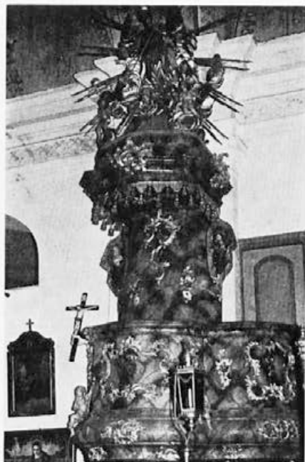
24 Troblje pri Slovenjem Gradcu, 60. leta 18. stoletja