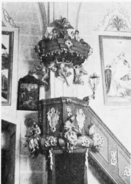
13 Sv. Uršula pri Dramljah, druga četrtina 18. stoletja