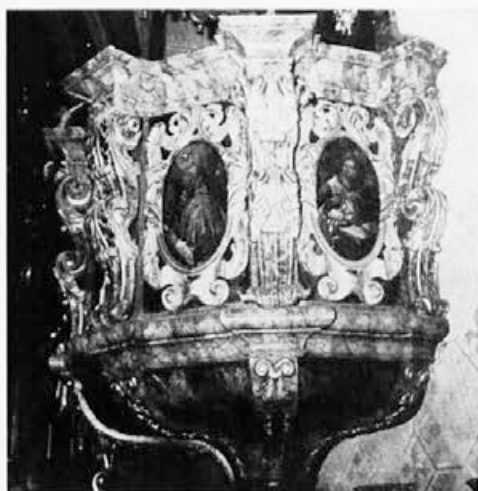
7 Apače, prva polovica 18. stoletja