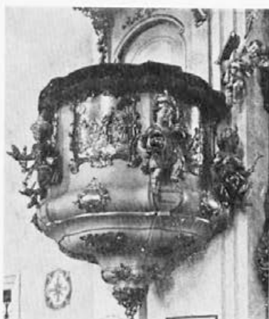
19 Jožef Holzinger : Studenci pri Mariboru, 60. leta 18. stoletja