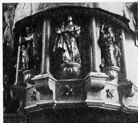
4 Radlje ob Dravi, začetek 18. stoletja