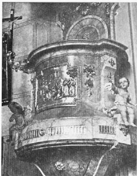
18 Jože Holzinger : Svečina, 70. leta 18. stoletja