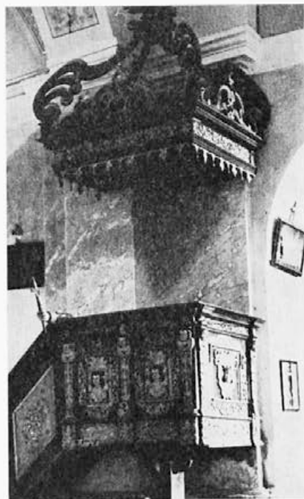
1 Vič pri Dravogradu, druga polovica 17. stoletja