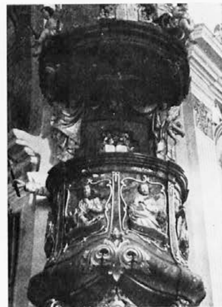
27 Jožef Wrenko-Mastnak: Gojka pri Frankolovem, 1863