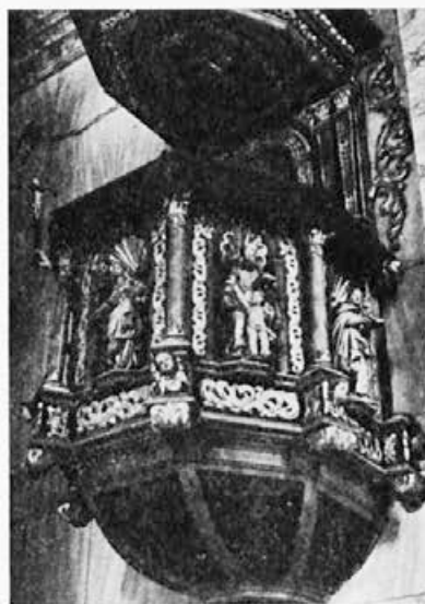
3 Olimlje, konec 17. stoletja