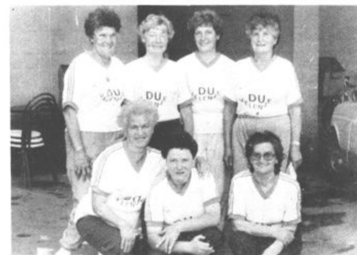
V kegljanju so se predvsem izkazale tekmovalke velenjskega društva upokojencev