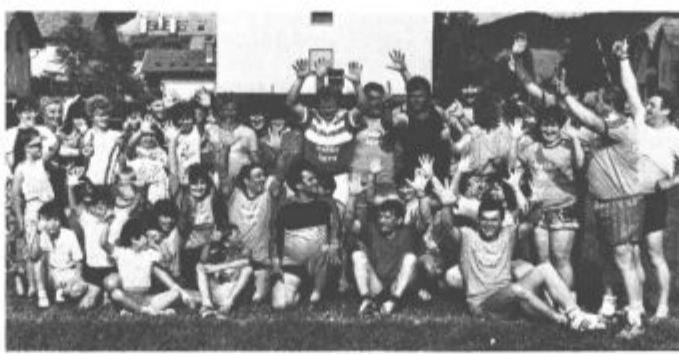
V deset minutah dobrih 31 metrov volne

Nedelja je običajni višek te prireditve in tudi tokrat je bilo tako. To so seveda vesele in razvedrilne igre z močnim poudarkom na narodopisnem izročilu kraja in okolice, na katerih so letos sodelovale ekipe šestih zaselkov te krajevske skupnosti.