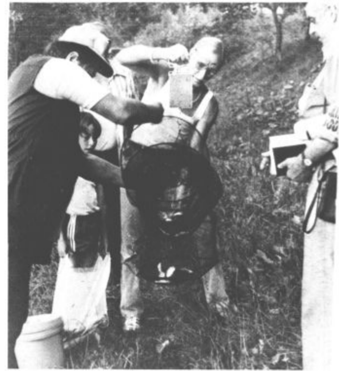
Tehtanje je bilo zelo natančno, saj vsak gram prinaša točko.