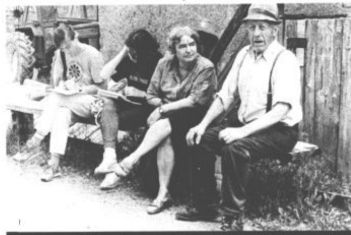
Mladi raziskovalci pri svojem delu

imajo, je prihodnost turizma v kraju ob tako onesnaženem zraku.«