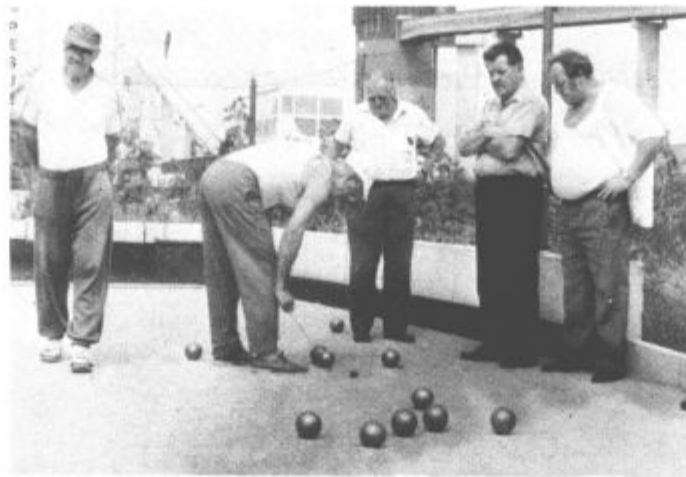
Kako vreči kroglo, da bo najbližje balincu

Končni rezultati so bili naslednji: 1. Titovo Velenje I, 2. Pesje, 3. Titovo Velenje II. Zapišimo, da se za ta šport zelo resno zanimajo vsa društva upokojencev v občini Velenje, to kaže tudi to, da bo Šmartno ob Paki dobilo balinišče te dni, Šoštanju pa se ta sreča obeta prihodnje leto.