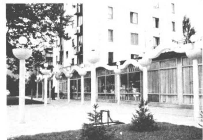
Pogled s Titovega trga

identitete preselili na desni breg Pake? Kako bi si sicer drugače razlagali »skrivnostno dogajanje«, pred vsem znano slaščičarno Movh? Začelo se je letos spomladi, ko smo opazili, da dreves pred slaščičarno nenadoma ni več. Kmalu je bilo jasno, da ne gre samo za vzdrževalna dela, vendar kaj bo tukaj nastalo, se je lahko samo ugibalo. Počasi so nastajali zametki neke betonske konstrukcije, torej bo nekaj novega. Čeprav je vse skupaj vzbujalo dvom, sva se odločila, da je najbolje počakati, da dobi vsa ta reč končno podobo. Vendar se tudi danes, ko to piševa, ne moreva znebiti občutka, da stvar še ni končana. Ne glede na to, se lahko ugo-