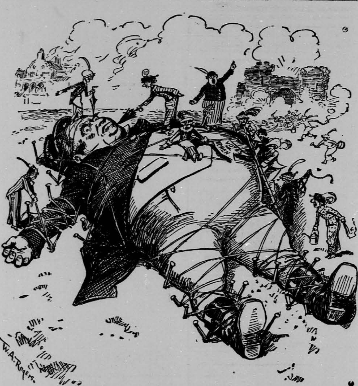
Slikar pri 'New York Herald' nam predstavlja na današnji sliki "delo" angleških sufragetk. — Od zadaj gori poslopje, tudi delo sufragetk. — Poor John Bull leži na zemlji zvezan, po njem pa lazijo najmodernejše gosenice — razjarjene sufragetke.

Washington, D. C., 12. aprila. — V poslanski zbornici se je pričela živahna agitacija za senator Cumminsovo predlogo glede novih prememb konstitucije ali ustave. Za naprej se namerava uvesti zakon, da bi naj odobrila samo četrtina vseh držav eventualno konstitucijsko premembo, to pa zaporedno dvakrat pri zasedanju v svojih postavodajah. Dosedaj je moralo odobriti amendment k ustavi tri četrtine izmed števila skupnih držav, ali 36 po številu; za naprej bi jih pa naj zadostovalo 12.