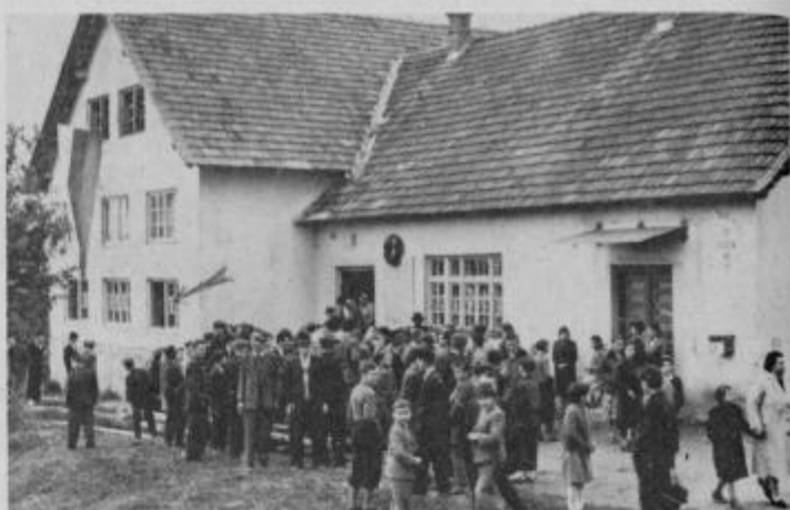
Pučica kaže zlomljeno okno kulturnega doma na Desterniku

Spotikanje ob teenagerjih ni kdo ve kaj prida pisarija, toda, če je takšna oblika edino učinkovito cepivo za pospeševanje delovnih navad in uvajanje v spodobne lastnosti človeške omike, bi se rad lotil vakcinacije najbolj ogroženih, se pravi onih, ki bi s svojim dosežanim početjem utegnili kvarno vplivati na neposredno okolico. Gre za mlade, ki so se v zadnjih časih zavozljali v pajčevino nezdravih in celo družbi škodljivih dejanj. Krdelo doraščajočih si je spletlo svoje gnezdo v kulturno-prosvetnem domu, ki je bil pred nedavnimi prenovljen, urejen, skratka postal je kulturno ogledalo vaščanov. Ponos in žulji so bili očiten dokaz zadovoljstva z njihovim kulturnim očakom. Mladi niso prispevali ničesar, zato ni čudno, da so brez poslušala do družbene lastnine „mesarili“ v notranjosti težko pridobljene kulturne ustanove. Neusmiljeno so razkosali odersko zaveso, lotili so se sten; prišlo je do obračunavanja s knjigami na odru, ki so brezmočno prenašale teptanje rogoviležev.