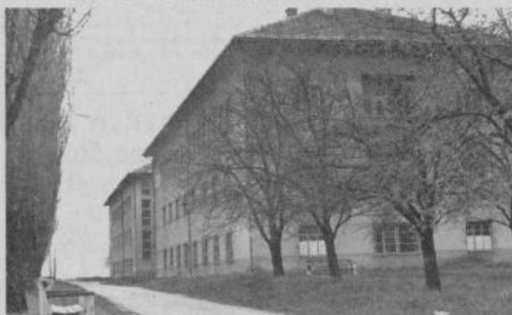
Dom počitka Dr. Jože Potrč v Zg. Poljčanah postaja pretesen za vse, ki bi želeli bivati v njem.

Kljub temu, da so Dom Dr. Jože Potrč v Poljčanah, kjer trenutno živi 260 ostarelih oskrbovancev iz občin Maribor in Slov. Bistrica redno obnavljali in preurejali, centralnega ogravanja še niso imeli. Ta pomankljivost je trenutno med najbolj perečimi problemi doma in bo potrebno v najkrajšem času najti rešitev.