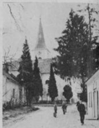
Pri Tomažu je lepo. Motiv s smrekami in cerkvijo v ozadju.

Za delo vsake organizacije so potrebni mladi ljudje, polni elana in volje za napredek in delo. Teh pa kljub vsem prizadevanjem pri Tomažu ni in ni. Sposobnejši odidejo v šole, drugi ostajajo doma in delajo na težki zemlji. Vključujejo se predvsem v gasilska društva, saj jih je na področju KS kar pet. Dve društvi sta si lansko leto kupili nova gasilska avtomobila. Prosvetno društvo je do letos lepo in v redu delalo.