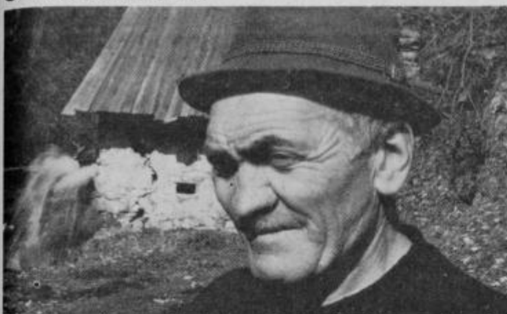
Ob vodnem mlinu v Zg. Novi vasi — eden od redkih, ki še opravljajo svojo obrt

Vedno hitrejša naraščanja avtomobilskega turizma v naši republici ima poleg mnogih prednosti tudi svoje slabosti. Razen tega, da je gibanje avtomobilskih turistov omejeno največkrat na ožje okolje kraja, kamor so prispeli z vozilom na izlet ali piknik, so le-ti prikrajšani za mnoge naravne lepote in ostanke iz preteklosti naše zgodovine, do katerih niso izpeljane sodobne ceste. Potrebno bi bilo stopiti peš, za kar pa velikokrat že zmanjka korajže, zato se zadovoljijo samo z obilnim obrokom hrane (zajtrk ali kosilo), ki si ga pripravijo na ognjišču, si ogledajo bližnjo okolico in zopet nazaj v vozilo.