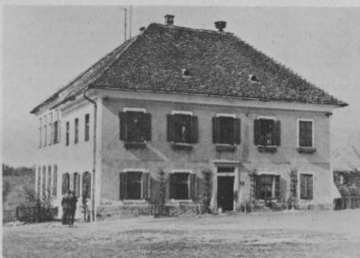
Iz stare šole bodo naredili obrat konfekcija in zaposlili približno 100 delav.

Tudi pri ureditvi krajevne ambulante je krajevna skupnost primaknila svoj delež. Komisija za sosedsko pomoč je ena najbolj aktivnih komisij te vrste, ki delujejo pri krajevnih skupnostih na območju občine. Sodelujejo prav vsi občani, največ pa šolarji. Sosedsko pomoč nudijo tridesetim ljudem. Vse