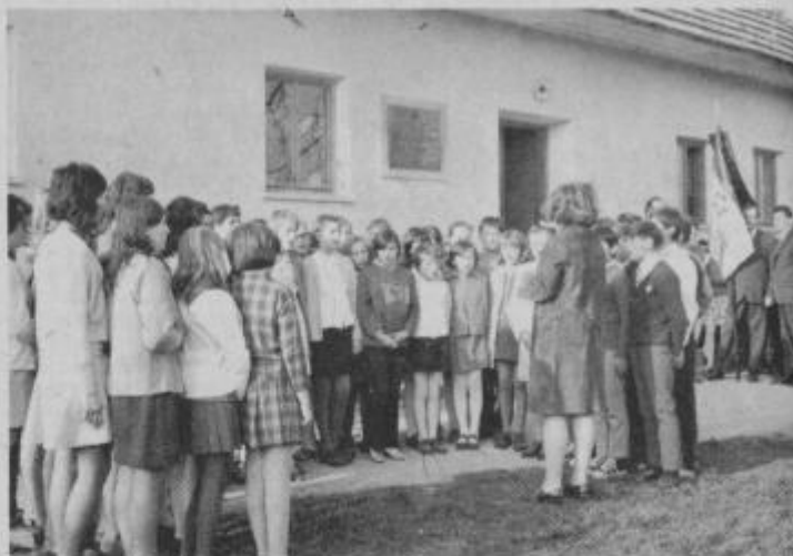
Z letošnje proslave pri Osojnikovi domačiji v Desencih