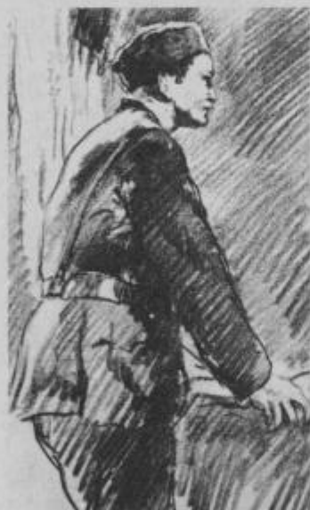
Boris Kidrič, kot ga je narisal B. Jakac