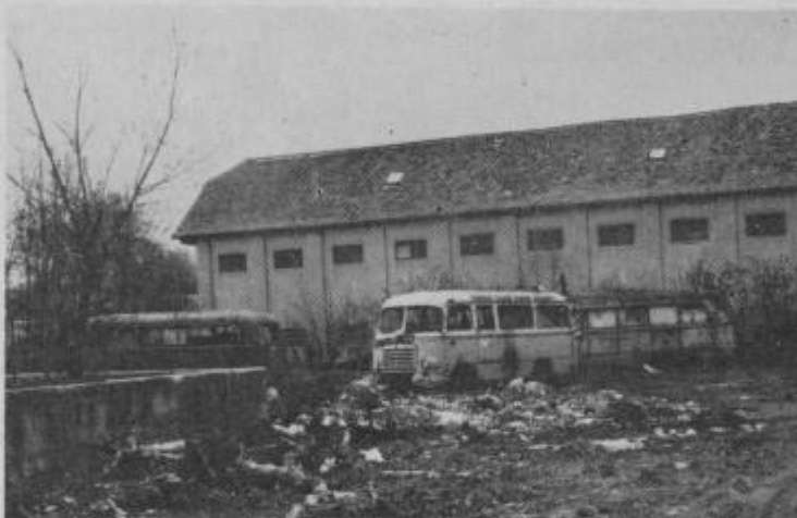
Dolgo je že tega, kar so se zadnji stanovalci izselili iz avtobusov. Ti razpadajo, smetišče pa se širi.

Skrb za lepše okolje se vse uspešneje uveljavlja v vsej Sloveniji, v vseh naseljih in zaselkih pa tudi izven njih je opaziti pomembne uspehe v tej smeri.