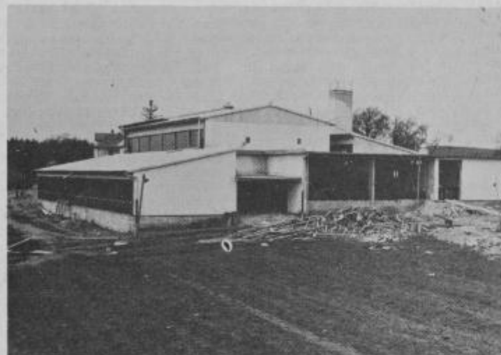
Nova šola, kjer bo poleg številnih učilnic tudi otroški vrtec in telovadnica.

Največja pridobitev Tomaža v zadnjih letih je nedvomno lansko Nadaljevanje na 10. strani