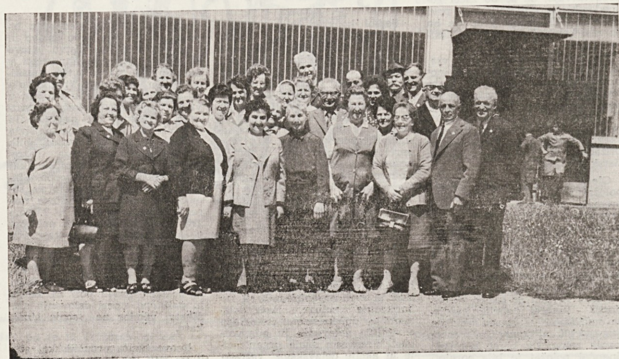
Naši upokojeanci ob sprejemu v tovarni.

13. V Kamniškem tekstilcu se objavljajo informacije o rezulta-