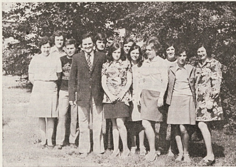
Novi direktor med novo poročenci.

konca avgusta, torej za obdobje ko je v naši odvetniški pisarni v Ljubljani dokajšnje zatišje. Pa vendar, v teh poletnih treh mesecih se je zateklo po pravne navete 1.353 naših članov, v zastopanje pa so naši odvetniki prevzeli 164 zadev (nad 12 %).