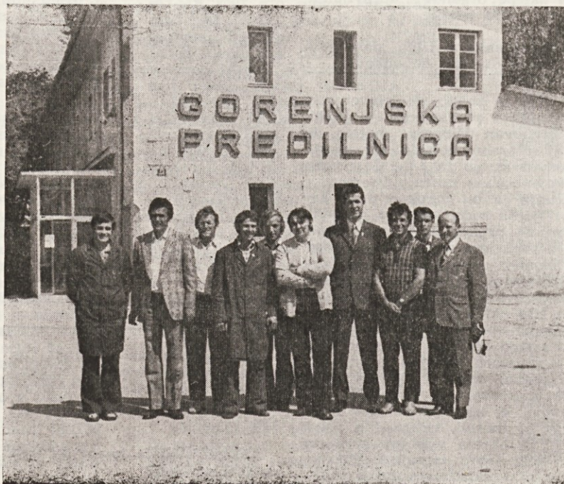
Obisk naših gasilcev pri gasilcih predilnice Škofja Loka.