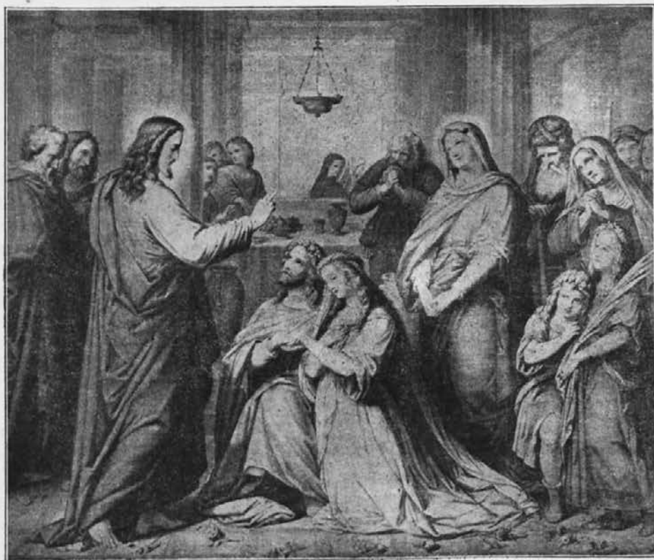
Na ženitnini Kani.