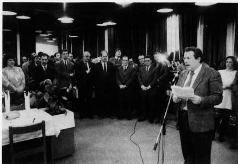
Prizor s srečanja v Kobaridu