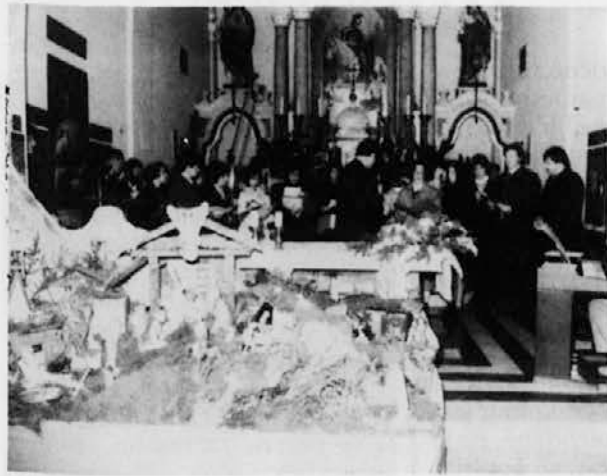
Sovodnje, 17. januarja 1993: mešani zbor Bilje-Orehovlje-Miren