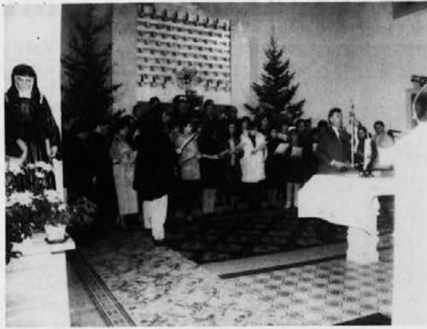
Mirenski Grad, 10. januarja 1993: združeni mešani zbor Miren-Rupa-Peč

Božičnice se postale že samodejni in neločljivi del našega vsakoletnega božičnega praznovanja. To lahko rečemo tudi za obe goriški božičnici, ki sta bili sredi januarja na Mirenskem Gradu in v Sovodnjah.