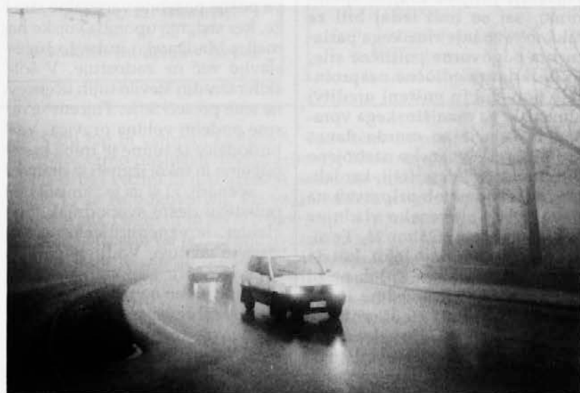
V mnogih predelih naše dežele je v zadnjem tednu nadvse gosta megla povzročila veliko nevarnosti na cestah. Več je bilo tudi prometnih nesreč, saj je bila ponekod vidljivost izredno slaba, posebno seveda v nočnih urah, čeprav so se vozniki, kot kaže, vedli izredno previdno, saj je bilo prometa v teh dneh znatno manj. Stanje se več dni nikakor ni hotelo izboljšati, megla se je razpršila šele v začetku tega tedna.