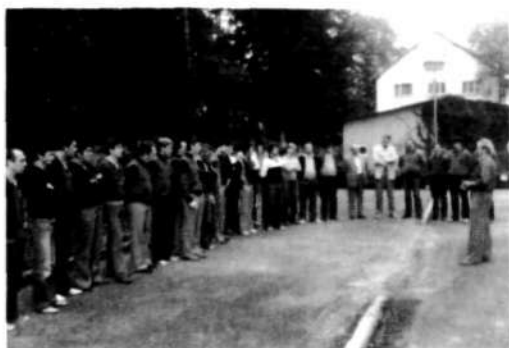
Udeleženci balinarskega turnirja ob otvoritvi dvosteznega igrišča BK Trata 1964