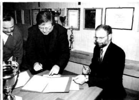
Podpis listine o prevzemu glavnega sponzorja kluba (tajnik in predsednik BK Trata in direktor podjetja Lokateks) leta 1998