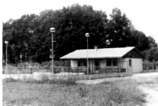
Odprto štiristezno balinišče BK Trata s klubskim objektom 1982

Ko smo prostor za igrišče že določili, smo prišli do same ilovice, na katero smo potem dali premogove ugasko