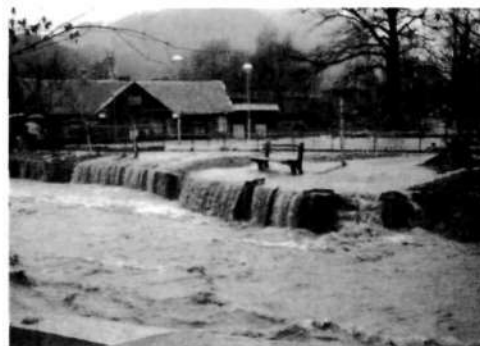
Balinišče Loka 1000 ob poplavi leta 1982

Pri začetni obnovi športnega igrišča so poleg članov kluba finančno pomoč prispevali ZTKO Škofja Loka in večje število balinarskih klubov iz različnih krajev Slovenije. Kasneje pa so se vsi stroški popravil, nadomestil in urejanje objektov krili iz tekočih sredstev kluba.