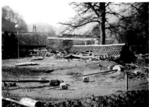
Balinišče Loka 1000 ob poplavi leta 1990 (na igrišču streha od objekta)

Druga balinišča v naši občini so nastala po letu 1970: pri gostilni »Pri Danilu« v Retečah, poleg stavbe v Solski ulici, kjer je imelo svoje prostore Društvo upokojencev in pri Športnem društvu Kondor na Godešiču. Vsa ta balinišča pa so bila kasneje porušena, ali pa je na njih dejavnost prenehala.