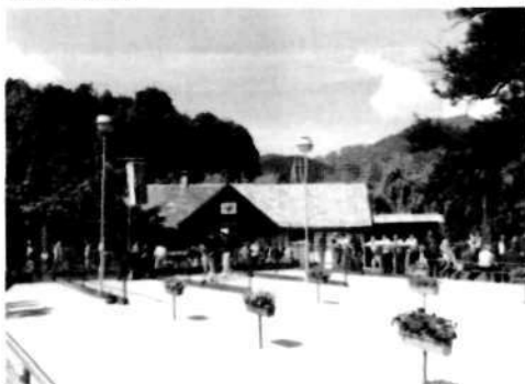
Štiristezno balinišče Loka 1000

Pri navajanju uspehov v klubskem tekmovalju in uspehov igralcev so navedeni samo uspehi kluba in igralcev sedanjega BŠD Trata na državnih, evropskih in svetovnih prvenstvih. Rezultati na območnih tekmovaljih in prvenstvih niso navedeni.