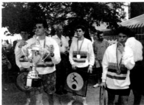
Vrnitev svetovnih prvakov v Slovenijo leta 1994