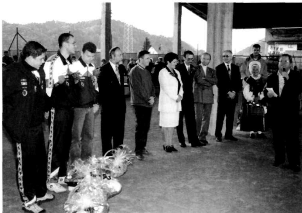
Sprejem igralcev BK Trata ob vrnitvi s svetovnega prvenstva leta 1998