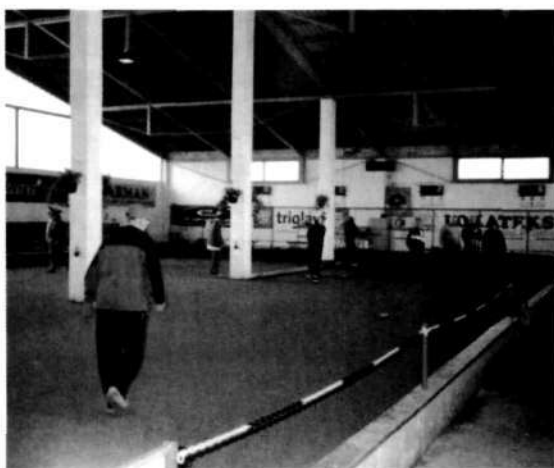
Balinarska dvorana BŠD Lokateks Trata 2003.

Prvenstva so organizirana za naslednje kategorije: dečki, mladinci, člani in članice.