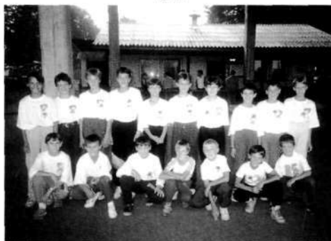
Udeleženci »šole balinanja« pri BK Trata 1991

Od tega leta dalje nastopa članska ekipa društva v državnem ligaškem tekmovanju pod imenom Lokateks Trata. Druga, mlada ekipa, v katero so vključeni vsi mlajši igralci in se v njej usposablja za kasnejše igranje v članski ekipi, tekmuje v I. območni ligi Gorenjske pod imenom sponzorja te ekipe Trata Vedri Alp. V klubu deluje še rekreativna ekipa, ekipa starejših članov kluba, ki nastopa v ligi starejših članov v Območni ligi pod nazivom Trata veterani.