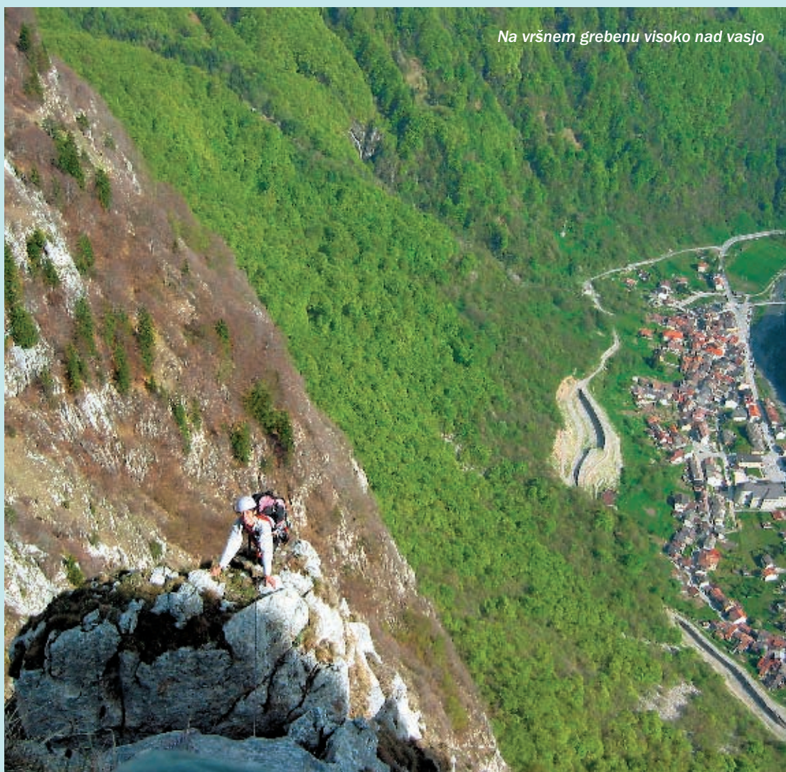
Na vršnem grebenu visoko nad vasjo

Zemljevid: Tabacco 09: Alpi Carniche, Carnia Centrale, 1:25.000. ●