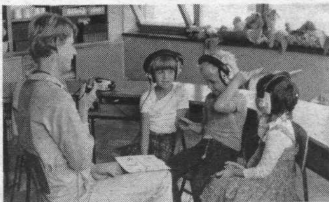
CENTER ZA REHABILITACIJO SLUHA IN GOVORA

Denar za izgradnjo bodo združevale mestne in republiške skupnosti otroškega varstva, zdravstvene skupnosti in izobraževalne skupnosti. Ker je v Centru največ otrok prav iz Ljubljane, bomo za novogradnjo prispevali tudi mi svoj delež.