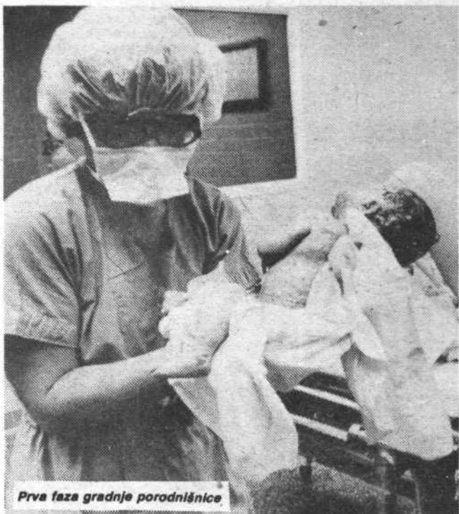
Prva faza gradnje porodnišnice