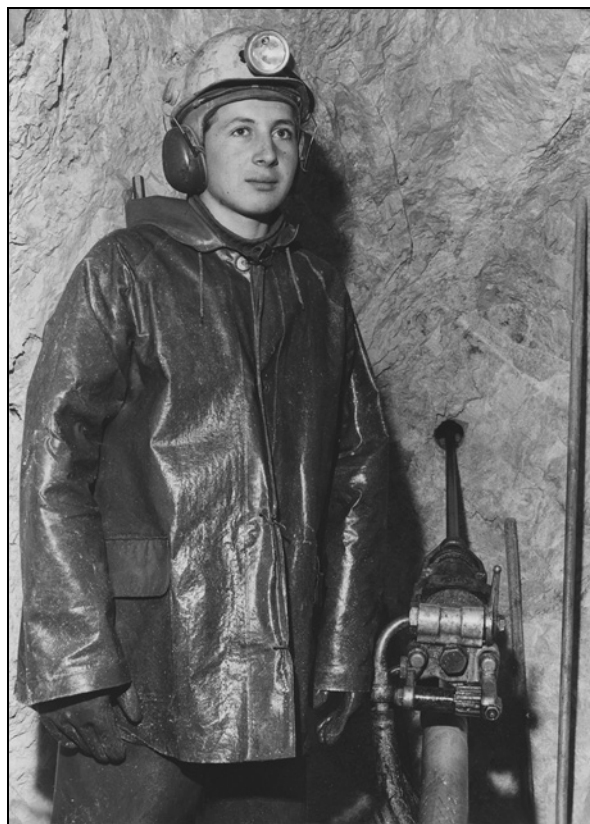
Dijak rudarske šole pri praktičnem pouku (iz zbirke Ernesta Logarja).

Šolsko leto 1961/62: Najpomembnejša pridobitev je bila razširitev šolskega programa na 3. razred poklicne šole s 17 učenci, zelo slabo pa je bilo dej-