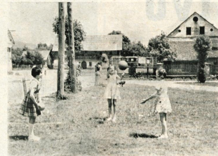
»Igrišče« sredi Senčurja. Naš fotoreporter je naredil ta posnetek zato, ker je menil, da bi ta del vasi moral biti vse drugače urejen, kot pa je že vsa povojna leta.

Pred dnevi so se sestali člani pripravljalnega odbora, da se natančneje pogovore o pripravah za prireditve v počastitev kranjskega občinskega praznika. Od 29. do 31. julija se bodo namreč vrstile mnoge športne in kulturno-prosvetne prireditve. V počastitev 900-letnice mesta Kranja bodo v sklopu Gorenjskega sejma prireditve zabavnega značaja, mnogo prireditev pod pokroviteljstvom kranjskega Turističnega društva pa se bo zvrstilo od 1. do 7. julija. V teh slavnostnih dneh bodo tudi številne otvoritve razstav iz različnega področja.