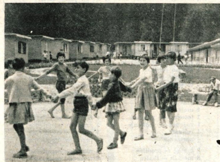
Slavonske vasi z neskončnimi ravninami so seveda dokaj drugačne kot oaza sredi naših gozdov. Zato so si malčki tudi pred opoldanskim počitkom dall duška in zaplesali kolo

K ROPA JE BILA TISTO POPOLDNE zelo tiha. Toda domačini so svetovali, naj bi še prišli tja na sprehod. Kadar je lepo vreme, pravijo, je zelo lepo iti do Jamnika in v druge kraje po obronkih Jelovice. Tudi kopaljšče, ki je zelo lepo urejeno, je ob poletnih popoldnevih, zlasti pa ob nedeljah zelo privlačno. Toda pretekla nedelja je bila cmeravo kisla, z dežjem, ki je pršil in z vetrom, ki je pihal po grapi. Zato so se domači fantje sestali kar ob ograji pred Muzejem in se menili o filmu in o pravkar končanih atletskih tekmah. Višje na trgu, pod orehom je posedalo nekaj možakov.