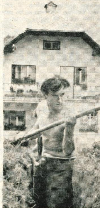
Še nekaj dni in voda bo pritekla do hiše. Davne, davne želje in obljube je uresničila samo enotnost in pripravljenost prebivalcev

Medtem je manjša skupina zaplesala kolo. Hišice so oživele in spominjale na oder z naravnimi kulisami. Toda kaj kmalu se je vse umirilo in utihnilo tako, da se je izza taborišča spodaj slišalo žuborenje potoka.