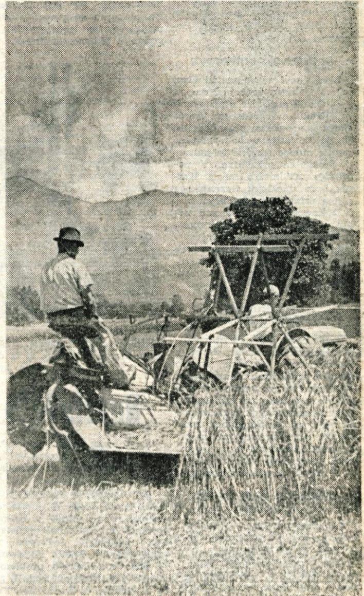
ZETEV SE JE PRICELA

vesnostjo na pokopališču je prevzel kolektiv tovarne Sava, patronat nad praporom organizacije ZB, ki ga bodo tudi razvil v nedeljo, pa ima kolektiv tovarne IBI.