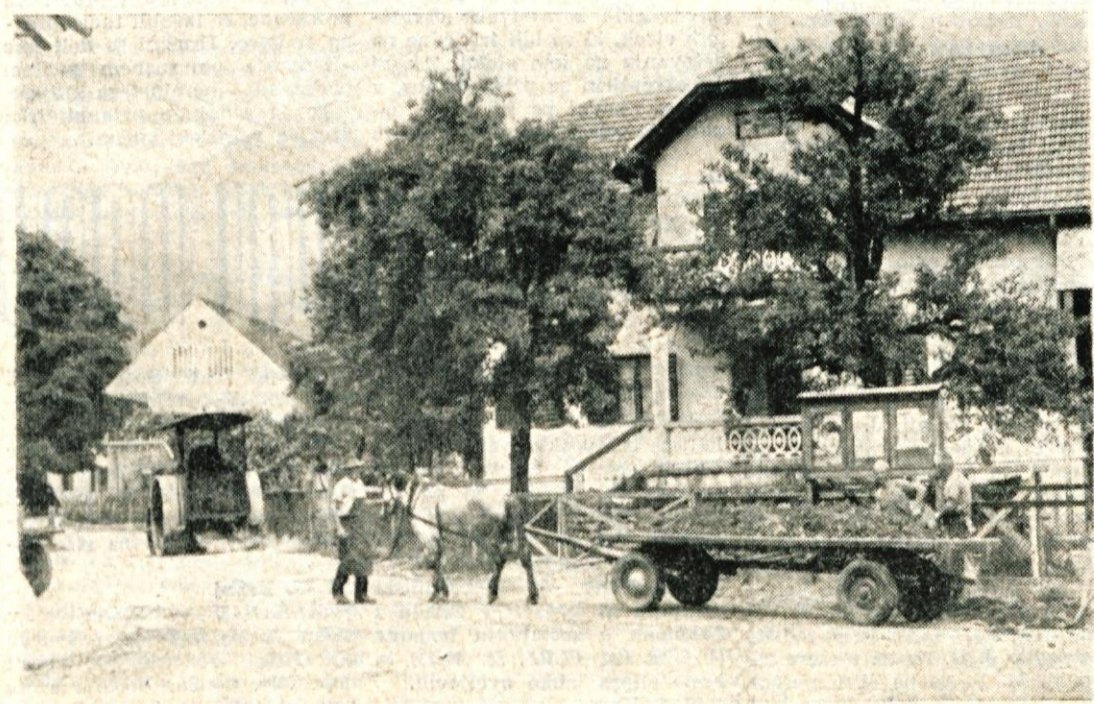
V Predvoru so sicer malo pozno začeli popravljati cesto, saj se je sezona že začela in so ob jezeru Črnavi že prvi kopaleci. Uprava za ceste Kranj vodi razširjanje ceste, ki jo bodo pol kilometra tudi asfaltirali. — Turistično društvo pa gradi ceste okoli Črnave