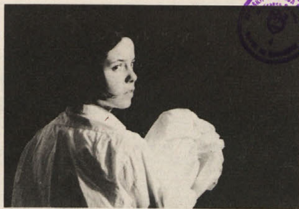
S predstave „Sonce nima hlačk...“