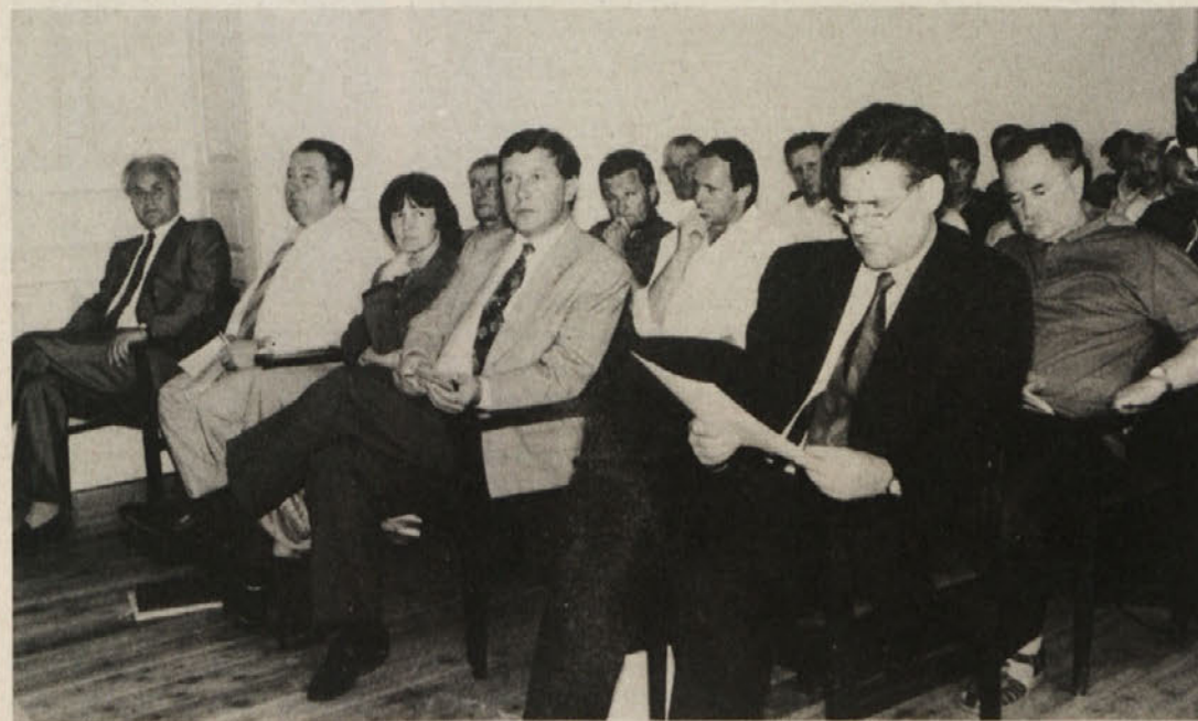
Občinstvo na zborovanju