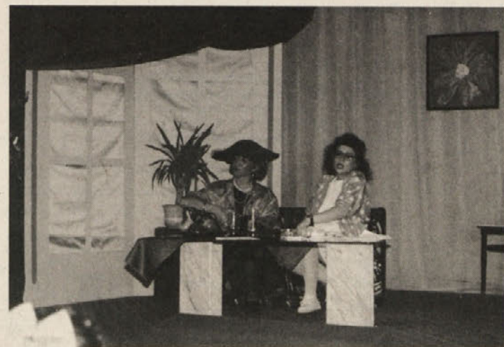
Križi in težave zaradi laži