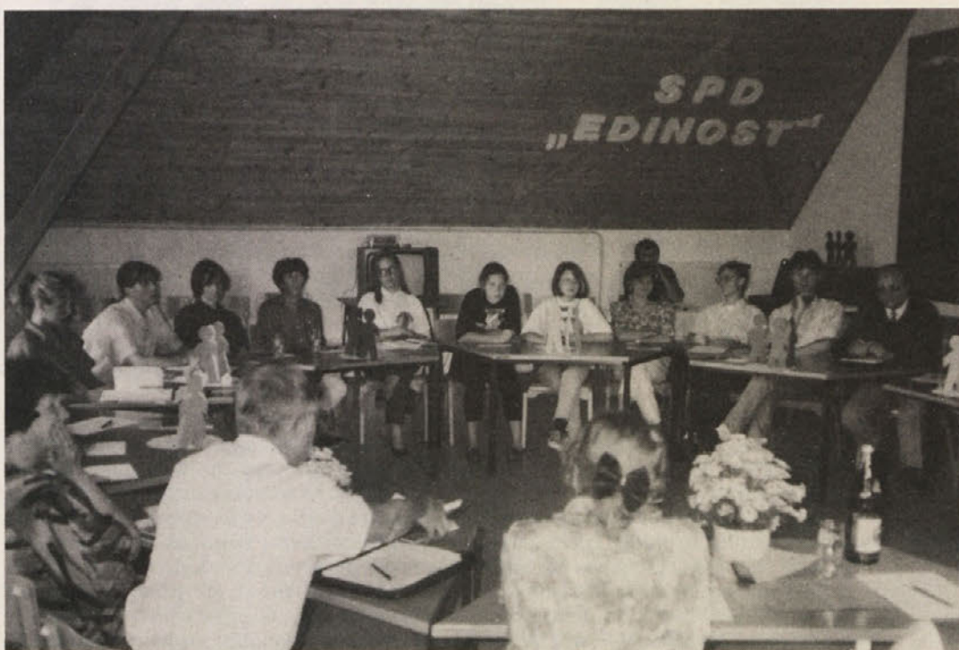
Na strokovnem prosvetu je bilo izrečenih precej kritičnih misli o odnosu uradne Koroške do dvojezične vzgoje otrok.

nem ozemlju (klavzula 5%!)). Temu je prilagojena tudi vzgoja v vrtcih. Dve leti pred vstopom v šolo je vzgoja obvezno dvojezična, za vrtce ne vključene otroke pa 400 (!) ur. Dvojezično področje je dotirano s petdeset procentov več proračunskih sredstev. Madžari imajo svojo poslanko v državnem zboru (Marija Pozsonec) „in pri nas se ne more zgoditi, da se posveta, ki ga pripravi (madžarska) manjšina, ne bi udeležili predstavniki političnih in v tem primeru šolskih oblasti. Kaj takega bi imelo politične posledice!“