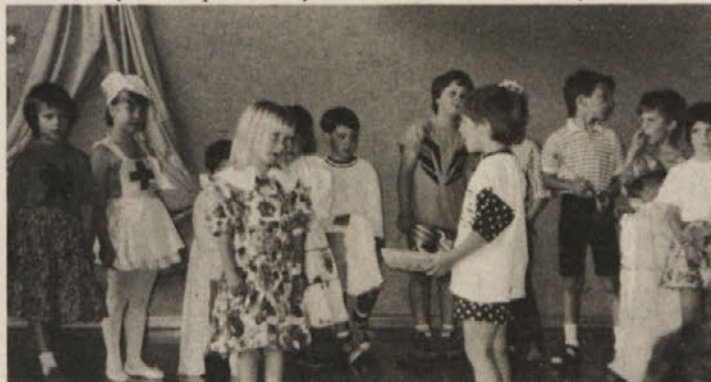
Mali Škofičani so nastopili z dramatisirano Pepelko.

Po tem zglednem dvojezičnem programu, ki ga je z navdušenjem pozdravljalo