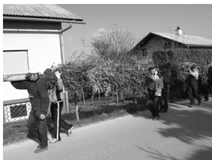
Presmec smo odnesli pred cerkev in ga tam postavili

V marcu smo izdelali in postavili butaro-»presmec«. Sodelovalo je 20 članov, ki so pridno priskrbeli zelenje, čeprav je bila letos cvetna nedelja že zgodaj. Proti koncu aprila smo presmec pospravili.