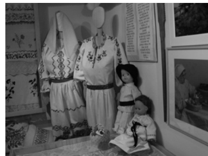
Izdelki iz lana

Odkar imamo datum 15. 6. 2008 določen za medzvezno gasilsko tekmovanje pri nas v Müžah, potekajo redne gasilske vaje dvakrat tedensko. Tekmovanja se bo udeležilo 17 ekip iz treh gasilskih zvez.