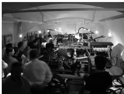
Slovenski gasilski muzej v Metliki

Naslednji dan, 4. 5. 2008, smo se udeležili svete maše, ker je bila Florjanova nedelja. Sveti Florjan je namreč zavetnik gasilcev. Maši je prisostvovalo 14 naših članov in članic.