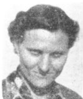
Najvirt: narodi naj drug drugemu zaupajo...

»Živimo v obdobju«, je dejal tov. Tito, »ko lahko nepremišljenost zaneti strašno vojno. Zato je vsem narodom tudi najmanjšim naloženo, da na miroljuben način rešujejo medsebojne probleme, narodi naj si med se-