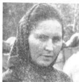
Skof: zavzeli so se za integracijo...

boj zaupajo in pomagajo. Strah pred vojno in uničenjem naj se spremeni v medsebojno pomoč in sodelovanje«. To so bile besede našega dragega predsednika, ki so last slehernega izmed nas, zato kaj bolj plemenitega ni mogoče povedati.