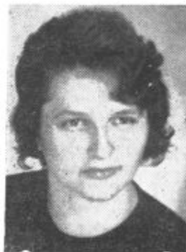
Levračičeva: z ustavo perspektiva tudi za kmete...

»Po novi ustavi imamo tudi kmečki delavci in zasebni proizvajalci široke perspektive nadaljnega razvoja, kar se že danes vidno odraža v sodelovanju s kmetiisko zadrugo. Z ustavo iz zakoni nam je zagotovljena socialna zaščita in skrb za človeka,