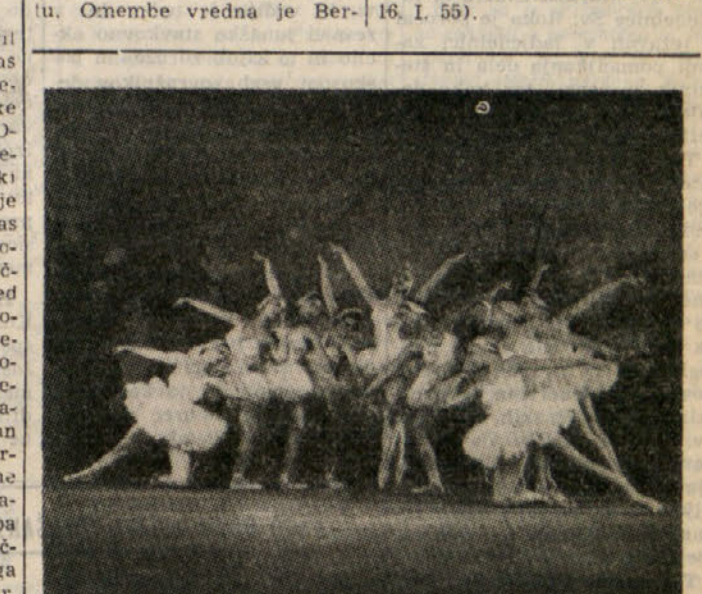
Balet «Labodje jezera» v državnem gledališču v Brnu