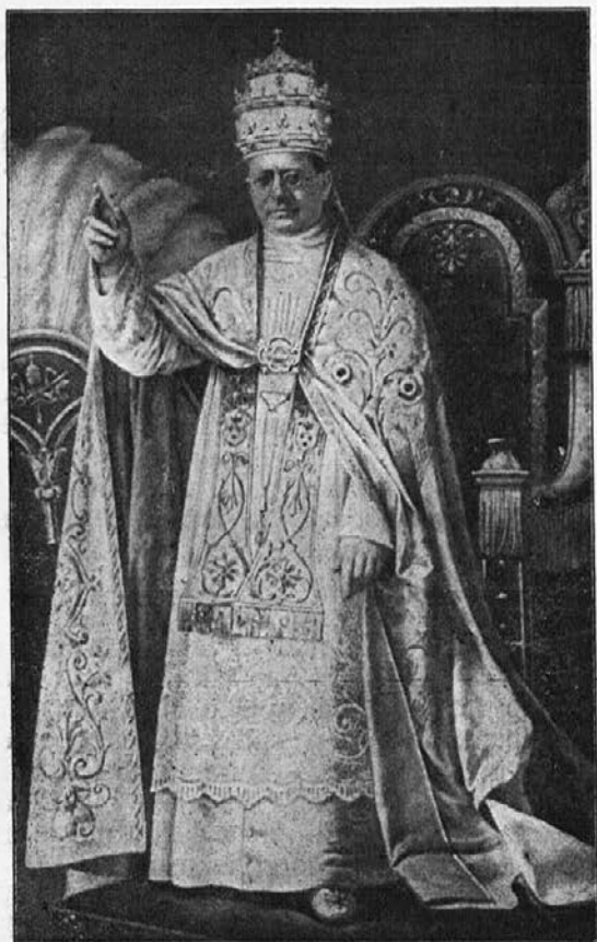
Sv. Oče Pij XI.

Ginljivo je videti, kako zamorski kristjani po otroško časte sv. Očeta v Rimu in kako so mu udani kot namest-