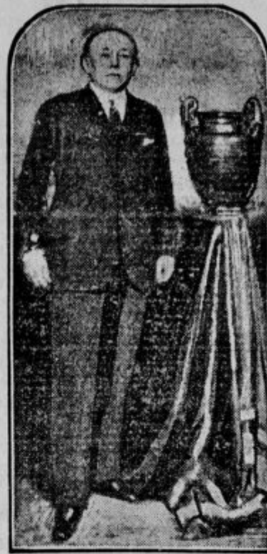
Poljski poslanik v Parizu,

Ozrla se je name solznih oči ter ilte povedala, da sva jo postavila ravno na hidrant ter da je prišel nekdo od mestnega vodovoda ter hišico pometal v kot, da je mogel do cevi.