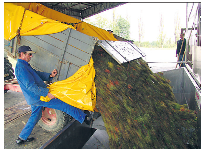
(Stiskanje grozdja v družbi Ljutomerčan): cene grozdja so v družbi Ljutomerčan že znane: od najmanj 55 do največ 150 za kilogram