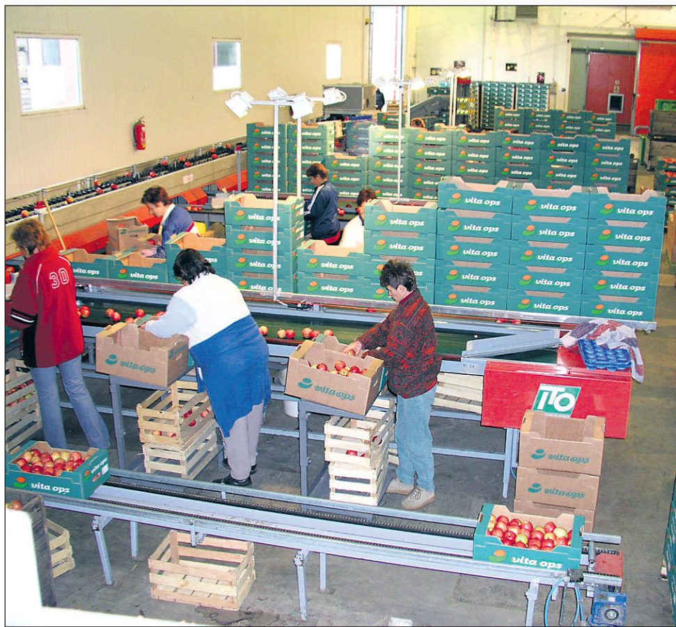
V sortirnici pride vsako jabolko na svoje mesto. Škoda je le, da kupci v trgovinah tega niso deležni, saj se sadje v trgovinah pogosto ponuja povsem neprimerno.

Ljutomer • Družba Ljutomerčan pričela trgategv in odkup grozdja