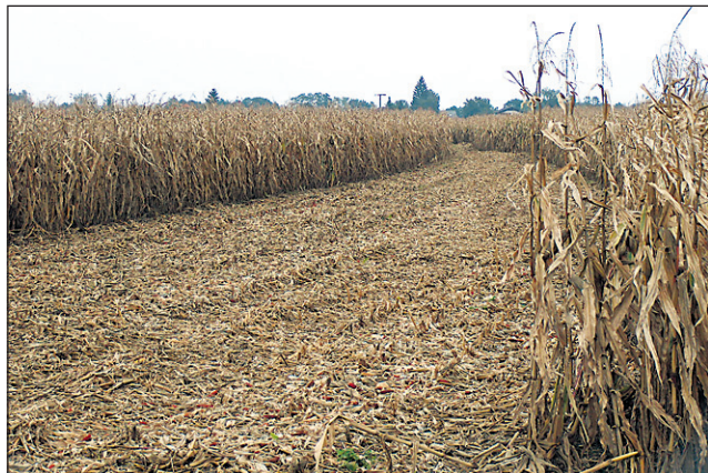
S pravilom koruze so težave; cena bo nizka, visoka vlaga pa jo lahko še prepolovi.

Večji pritisk za odkup grozdja se po besedah Janžekoviča lahko pričakuje z začetkom trgatve šipona in laškega rizlinga: “Kako bomo potem to reševali, zdaj ne morem reči. Načeloma pa nepogodbenih količin ne odkupujemo. Sicer pa je podoben sistem odkupa na osnovi pogodbe načrtovan tudi pri ostalih panogah kmetijske proizvodnje. Potrebna bodo dolgoročna partnerstva z vsemi obveznostmi in tudi praviciami. Za anarhijo na trgu ni več prostora!”