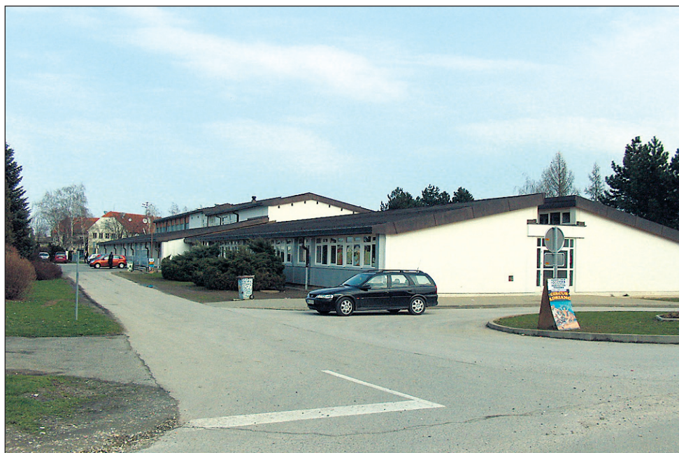
Dornavska osnovna šola postaja že sinonim za finančne "spodrsiljaje"...

Pri vsem skupaj gre najverjetneje še najbolj za nagajanje in nesposobnost najti primeren, razumski in kompromisen način reševanja nastalih težav. Očitno pa tudi za pomanjkanje želje, da bi vso zadevo res začeli reševati. Mogoče pa je vsa situacija le odraz nepodpore ali prikritega nestrinjanja večine občinskega sveta z novim vodstvom šole, ki ga sicer nihče ne upa ali noče izraziti direktno?!