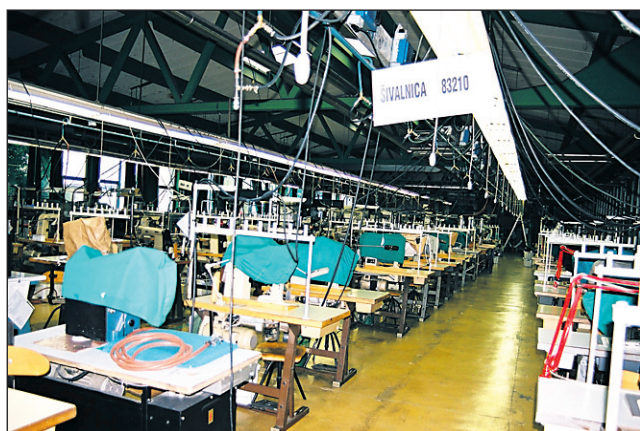
Proizvodna hala s stroji v Majšperku še vedno čaka na svojo usodo.