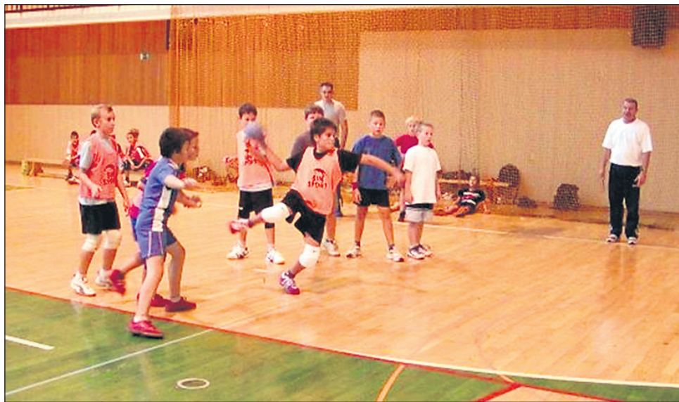
Mladi rokometarji v RŠ Ptuj, stari 9 in 10 let, med igro.

V društvu upamo, da bodo odgovorni v naši občini kmalu poskrbeli za kakšno večnamensko dvorano, ki bo vsaj deloma olajšala delo v športu tistim, ki potrebujemo večje