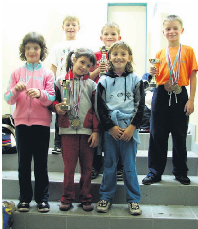
Najboljši iz kategorije letnikov 98 in mlajši