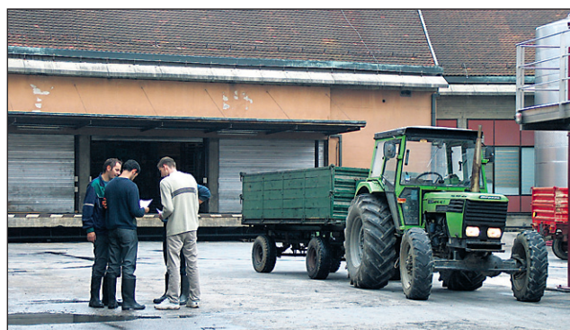
Letos lahko vinogradniki (ne glede na to, ali so direktni kooperanti Kleti ali pogodbeniki oz. člani KZ) grozdje prodajo Ptujski kleti le, če so pravočasno podpisali petletno pogodbo o sodelovanju.

Cena grozdja bo sicer do ločena ali v času trgatve, še bolj verjetno po koncu trgatve. Kakšna bo, še ni znano. “Upam, da, glede na to, da grozdja ne bo ravno viška, ne bo preveč pritiska na znižanje cene. Člani in pogodbeniki KZ pa lahko pričakujejo izplačilo v 14 obrokih, kot je v pogodbi navedeno, v KZ pa se bomo gotovo držali pogodbeno določenega roka izplačila!”