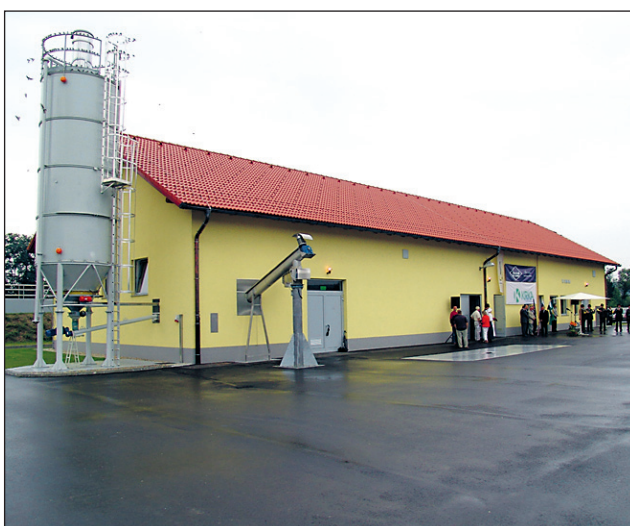
Čistilna naprava v Ljutomeru bo do junija prihodnje leto obratovala poskusno.

Vrednost čistilne naprave znaša 1.023.961.381 tolarjev, od tega je delež javnega kapitala 47,26 odstotka, delež