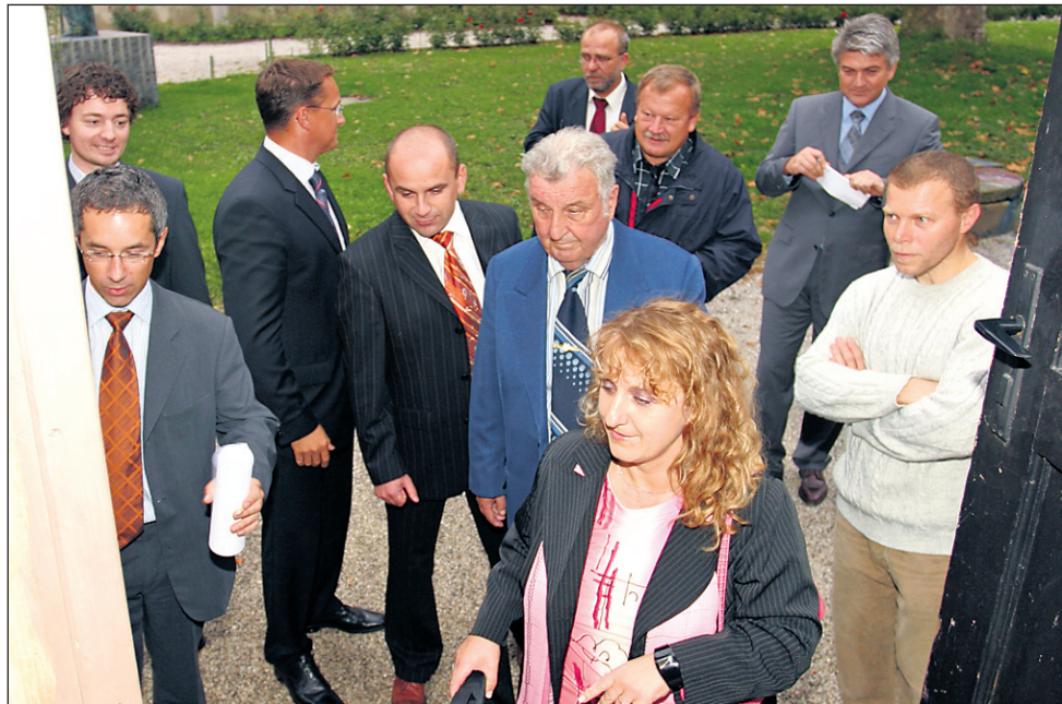
Akterji ptujske okrogle mize o turizmu pred začetkom razprave na gledališkem odru, ko so si še pustili odprta vsa vrata in opcije.