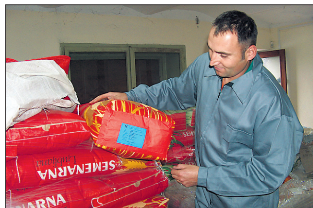
Seme s certifikatom zagotavlja kvalitetnejši in večji pridelek.

Sicer pa v trgovinah KZ zraven semena, kot pravi Valenko, zelo ugodno nudijo tudi mineralna gnojila in zaščitna sredstva, ki jih lahko pridelovalec izbere glede na lastne potrebe: »Posebej priporočamo nakupe takrat, ko je repromaterial najcenejši oz. v prodajni akciji. Tako smo za pridelovalce v naših trgovinah pripravili še posebne dodatne jesenske popuste. Ob sklenitvi kooperacijske pogodbe za setev ozimne pšenice pa nudimo še možnost proizvodnega kreditiranja ter dodatnih strokovnih priporočil s strani naše kmetijske službe, ki je prisotna v vseh kmetijskih trgovinah.«