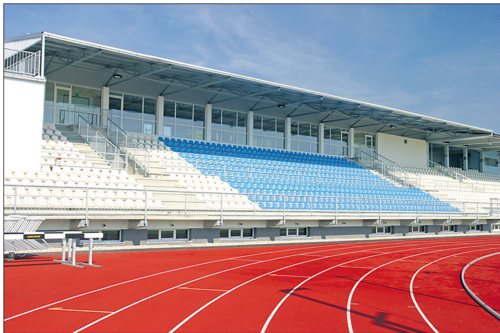
Mestna občina Ptuj se je pri treh investicijah odločila za leasinge, med drugim tudi za izgradnjo vadbenih površin pod tribunami na Mestnem stadionu na Ptuj - I. faza.