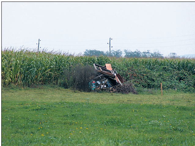
Kupe in kupčke odpadkov je najti povsod po videmski občini - z novim odlokom po mnenju svetnikov ne bo kaj bolje, le kazni bodo še višje.

Iz svetniških vrst pa je bilo slišati tudi hudo pikro (pa vseeno resnično), da bo očitno treba v prihodnje del domače parcele nameniti za več odlagalnih posod in da bodo tisti, ki zazidalne parcele šele kupujejo, morali razmisлити o nekaj kvadratih več, saj bo najprej potrebno zagotoviti prostor za »kante«, potem šele za hišo in kaj drugega ... Tudi občina bi že morala poskrbeti za lokacije za zbirna mesta oz. ekološke otoke, kar v Vidmu očitno še ni urejeno. Takšna zbirna mesta bi, kot je bilo indirektno razumeti, vsaj malo ublažila odlaganje na črno, kajti če ne veš, v katero posodo bi doma kaj odložil,