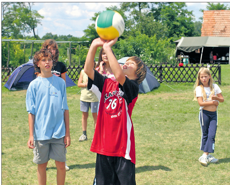
Otroci, katerih starši niso zaposleni in imajo torej čas za vzgojo svojih potomcev, ne bodo imeli več prednosti pri vpisu v vrtec.