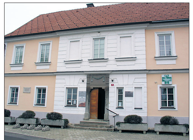
Bo krajevna upravna zgradba kmalu postala občinska?