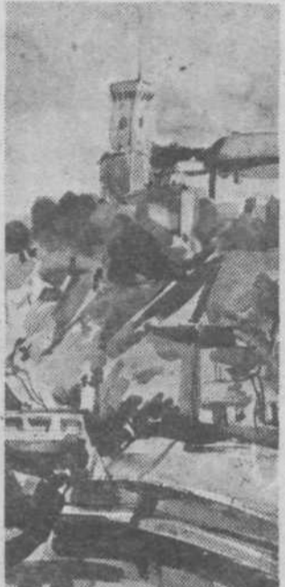
Janez Ošabn, Ljubljanski grad, akvarel, 1982