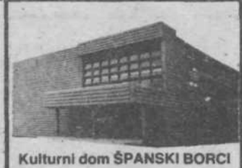
Kulturni dom ŠPANSKI BORCI

Krajina, posejana s številnimi, preprostimi a hkrati po domiselnosti bogatimi podeželskimi hišami, hlevi, skednji in drugimi gospodarskimi zgradbami, so nekaki stalni sestavni deli Ošabnovih motivov. Tudi kadar je avtorjevo zanimanje osredotočeno samo na izsek iz narave, ne manjka sledov pristnosti človeka oziroma njegovega dela. Tako je npr. k vodi, ki je tudi zelo priljubljena slikarjeva snov upodabljanja, zelo pogosto dodan jez in podobno. Privlačnost Ošabnovih slik pozivlja tako na eni strani njegovo veliko spoštovanje se stare podobe našega, slovenskega okolja, v katerem ima slikovita nenadomestljiva patina starosti podobno vrednost, kot jo tu pa tam izbranim motivom ponujajo bogate oblike cerkva in gradov na Slovenskem, po drugi strani pa je za našega avtorja značilno ponavljanje in vračanje k istim motivom, posebno v risbi, ki nastopa kot hotena samostojna upodobitev. Ker nastane akvarel dosledno kot prvi neposredno odziv na barvno senzacijo motiva, izstopajo oziroma so uspešnejši tisti akvareli, pri katerih je izraz barvnega tkiva in razmaha enotnejši in celovitejši, kjer je vsaka barva na pravem mestu in ni sledov popraviljanja. To pa je tudi sicer vselej pogoj dobrega akvarela, za ka-