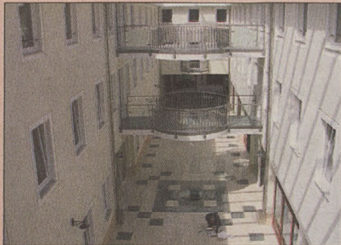
Bo tu sedež upravnega okraja?

brez upa zmage, izrabljajo za svojo osebno uveljavitev! V ospredju predvolilnega boja so imena kandidatov, v ozadju pa, menijo ljudje, mnogo bolj pomembne stvari.