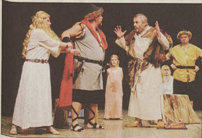
Igralska skupina društva Trg