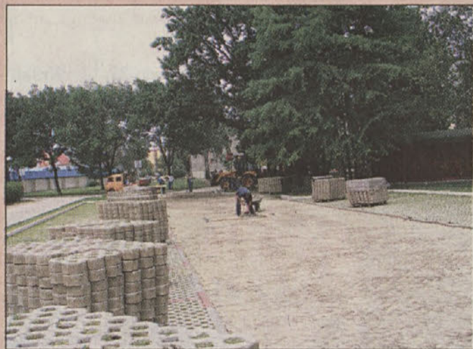
Brežice: prenova novih parkirišč

Molana , da bi do volitev dobili vsaj lokacijo za večnamensko dvorano. V skrčeni zasedbi so mu pritegnili občinski svetniki, ki so v razpravah enotno nasprotovali dvorani pri Osnovni šoli Brežice. A so vsi, brez izjeme, nato izglasovali prav to neprimerno lokacijo! Le kdo bi si v predvolilni vročici upal nasprotovati gradnji športne dvorane! Očitno so v ozadju višji interesi, kajti le malce ozreti se je treba naokoli in najti ustrenejše mesto za pravi športni dom, kot je predlagal svetnik