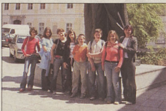
Mladi lutkarji OŠ Krmelj na državnem srečanju lutkovnih skupin Slovenije v Kranju pred Prešernovim spomenikom in Prešernovim gledališčem