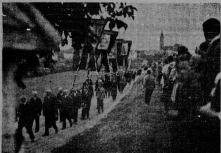
Procesija sv. Rešnjega Telesa v Šmihelu

„Unitas“, Ljubljana, Selenburgova ul. št. 7/L, posreduje nakup in prodajo starih strojev. Evidenca vseh priložnosti.