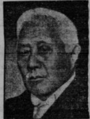
Admiral Saito, doslej japonski guverner na Koreji je dobil nalogo sestaviti novo japonsko vlado.