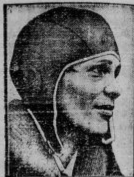
Amelia Earhart-Putman, drzna Američanka, ki je v soboto sama v letalu preletela Atlantski ocean. V petek ob 22.50 se je dvignila z letalom iz Har- bourja na Novi zemlji v Ameriki in v soboto po- poldne je pristala v pokrajini Ulster na Irskem.