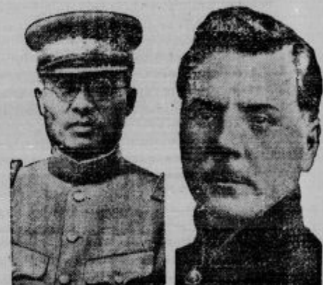
Vojna nevarnost med Rusijo in Japonsko resno ogroža mir na Daljnem Vzhodu. Na sliki (levo) japonski general Honjo, ki je prevzel največje japonskih čet v Madžuriji ter prodira proti ruski meji. Na desni: Vorošilov, ruski ljudski komisar za vojne zadeve.