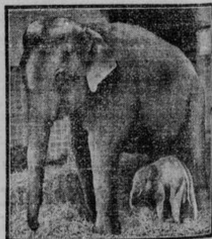
Veseli dogodek v slonovi družini: V monakovskem zoološkem vrtu je slonica Cora vrgla slončiča, ki se prav dobro razvija. Je že 100 funtov težak in 81 cm visok.