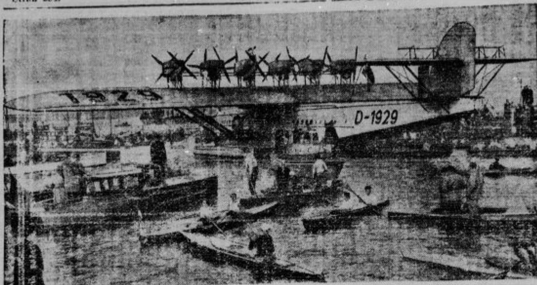
Zračni orjak Do X, ki se je po zraku pripeljal iz Amerike v Nemčijo, pri spre- jemu v Berlinu. Vpriču tega zračnega orjaškega letala s čolnom so vsi drugi čolni na vodu kar pritlikavi.