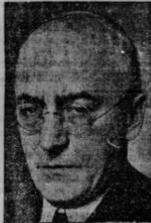
Nemški državni kancler (ministrski predsednik) dr. Brüning je s svojim kabinetom odstopil.