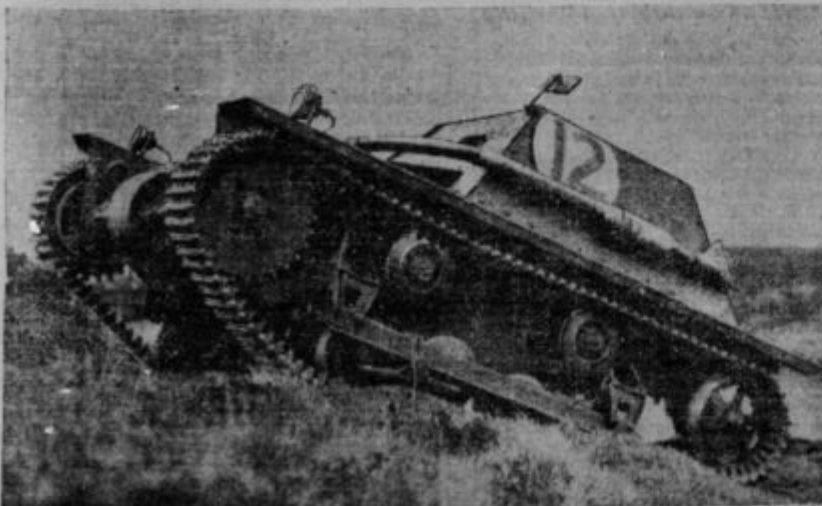
V znamenju razorožitve! Nov majhen tank angleške armade, dobro snaspikanc s topiči in strojnicami, ki brzi tudi po najhujši strmini, po ravnem pa dohaja tudi avto.