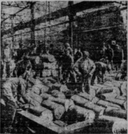
Živio vojna! Edina industrija v Ameriki, ki je v polnem obratu, je tista, ki za Japonce izdeluje fiole jeklene granate. Slika nam kaže pogled v skladišča.