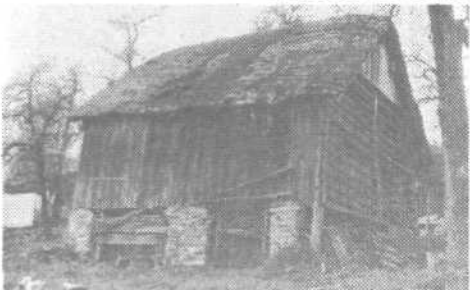
Skedenj star preko sto let. Marsikatera zgradba na Veliki Slevici sega še v čas Levstika in Stritarja