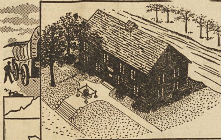
Newcom's Cabin now a Museum in Dayton.

His first advertisement called attention to his grant and invited their co-operation. Three months later he published an elaborate pamphlet in Trenton, painting the advantages of the Symms Purchase in glowing and inviting colors. This was followed several